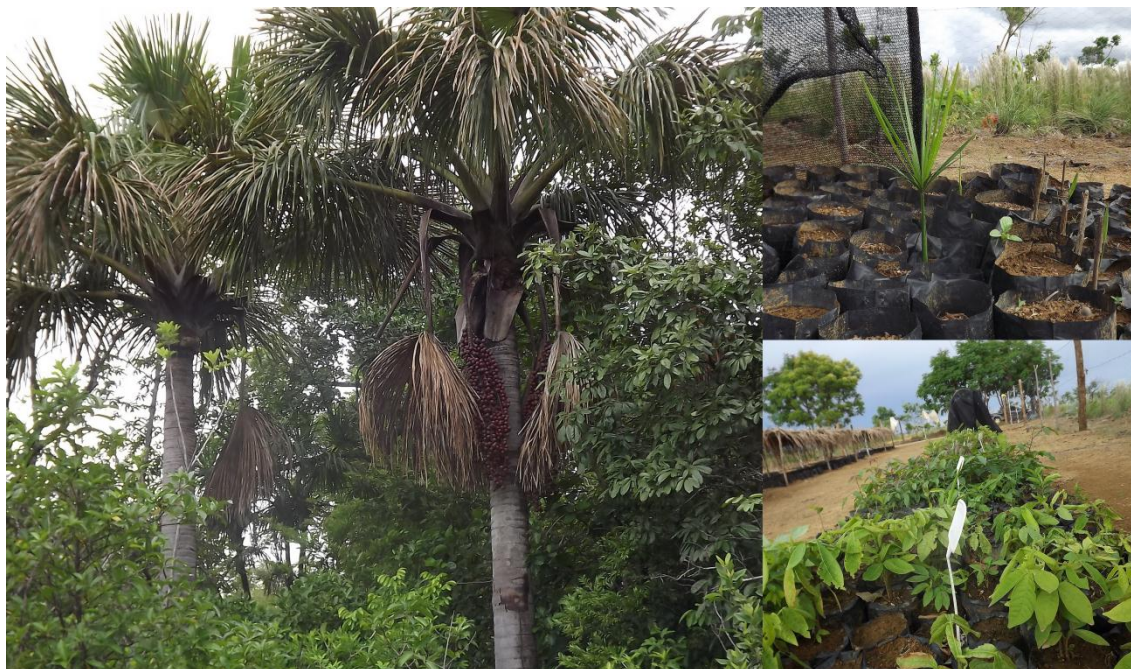
Fotografia 6 – Local onde se coleta as sementes do buriti, que são tratadas e depois plantadas no viveiro plantas.