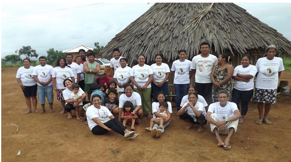
Fotografia 2 : Participantes do Instituto Yukamaniru na aldeia Kuiakware.