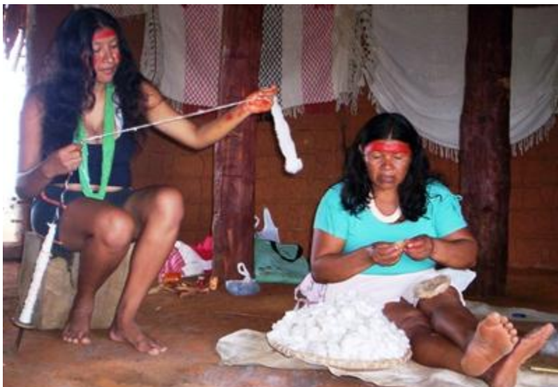
Fotografia 4: Duas mulheres Bakairi do Projeto Kâdâkêrâ em uma oficina e expõem os modos de fazer: à esquerda como transformar o algodão em fios e à direita o preparo dos novelos e o descaroçar o algodão. Ao fundo redes já produzidas na aldeia Kuiakware.