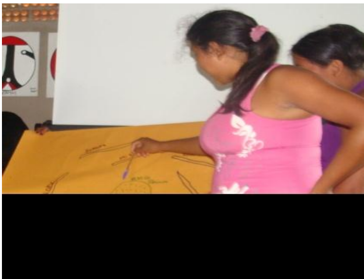
Fotografia 7 - Mulheres moradoras do Pakuera, em apresentação do mapa da aldeia. Autor: Isabel Taukane Data: 2012 Fonte: arquivo Instituto Yukamanniru

Uma das atividades propostas foi desenhar o mapa das suas aldeias, a qual comprovou que as mulheres, de aldeias menores, percebem mais o espaço que ocupam. Elas desenharam o mapa sem dificuldades e com detalhes de nome de córregos, nomes dos moradores e que a aldeia possui rede elétrica, campo de futebol. Entretanto, as mulheres da aldeia Central Pakuera tiveram dificuldades em elaborar o mapa que chegasse próximo ao que Pakuera é conforme as fotos abaixo.