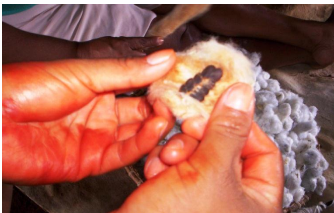
Fotografia 3: Mãos pintadas de urucum seguram uma semente de algodão no fundo sementes de algodão. Data: 2011

O primeiro projeto executado pelo Instituto Yukamaniru é fruto de uma parceria com a associação Halitinã do Povo Pareci 17 . Manifestamos, assim, o nosso desejo de ter um projeto que fosse a nossa cara e trabalhasse com as coisas que sabíamos fazer, ou seja, um projeto que tivesse uma identidade étnica. Na conversa com as integrantes do Instituto verificamos que o que permeia o universo feminino Bakairi é a confecção de redes de dormir ( âedâ ) e existia a preocupação com as sementes tradicionais do algodão, visto que as mulheres Bakairi estavam adquirindo fios industrializados na cidade para a produção das redes e deixando de lado o seu cultivo e o modo de fiar.