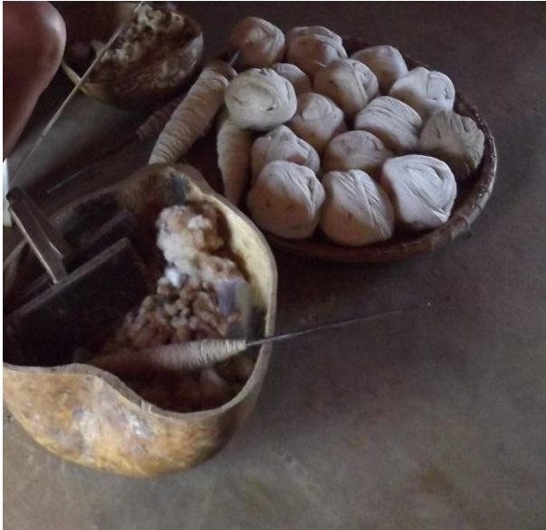
Fotografia 5: Algodão marrom dentro de uma cabaça e material para fiar o algodão: novelos de algodão já fiados dentro de cesto.