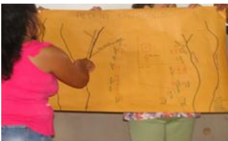
Fotografia 8 - Mulheres moradoras do Kaiahoalo, em apresentação do mapa da aldeia. Autor: Isabel Taukane Data: 2012 Fonte: arquivo Instituto Yukamanniru