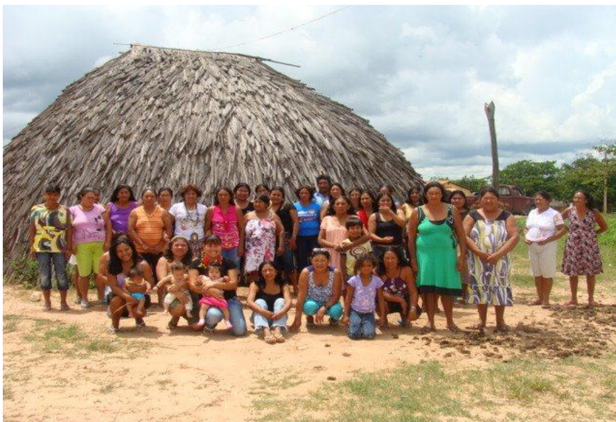
Fotografia 1 - I Encontro de Mulheres Indígenas Bakairi no pátio central da aldeia Pakuera/Paranatinga (MT). Data da foto: 2009

O nascimento do Instituto de Apoio às Mulheres Indígenas Bakairi para o mundo institucional burocrático aconteceu no dia 04 de novembro de 2008, conforme a certidão de personalidade jurídica registrada em cartório em Cuiabá/MT. Para finalidade de análise e para melhor entender as motivações para a sua criação, é necessário compreender alguns aspectos que serão aqui abordados.