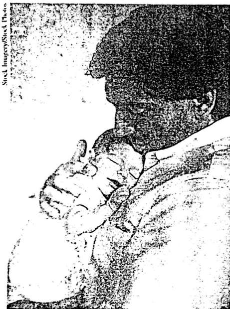
Para Vygotsky, a criança nasce em um mundo cultural.

simples) entrelaçam-se aos processos culturalmente organizados e vão se transformando em modos de ação, de relação e de representação caracteristicamente humanos.