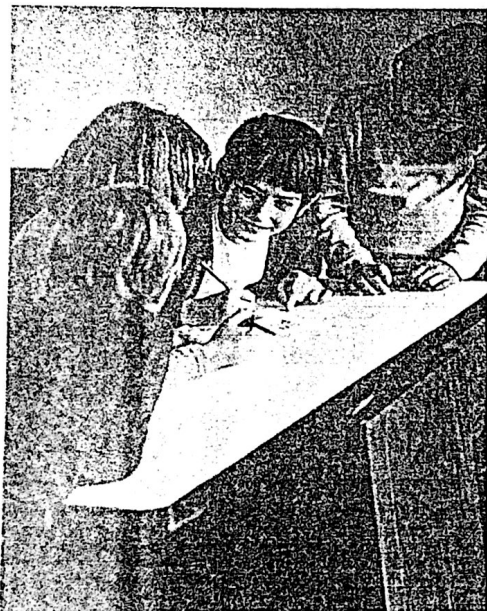
É através dos signos que realizamos muitas de nossas ações.

Utilizamos os signos para desempenhar diversas atividades. Anotar um compromisso na agenda, fazer uma lista de convidados, colocar rótulos em objetos, usar palitos para fazer contas, contar uma história, seguir uma partitura musical, fazer a planta de uma construção, são formas de utilização de signos que ampliam nossas possibilidades de memória, raciocínio, planejamento, imaginação, etc.