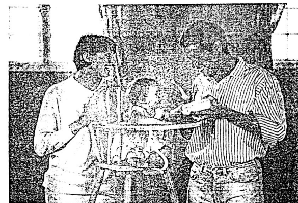
A criança conhece o mundo por meio de suas relações com os outros.

Ao estudar o desenvolvimento da criança, as patologias e a deficiência mental, Vygotsky baseou-se em observações e experimentação em situações variadas. Ele defendia a idéia de que o trabalho experimental não devia limitar-se a modelos de laboratório divorciados das situações naturais da vida, podendo ser realizado em situações de brincadeira, de aprendizado, nas conversações informais, na escola, na família ou em um ambiente clínico.