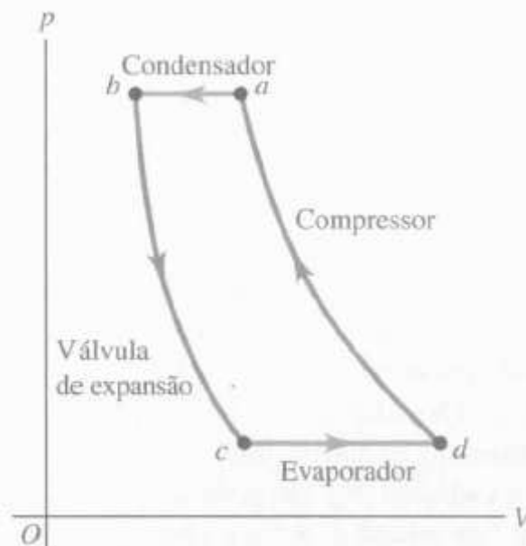
FIGURA 18.21 Problema 18.43.