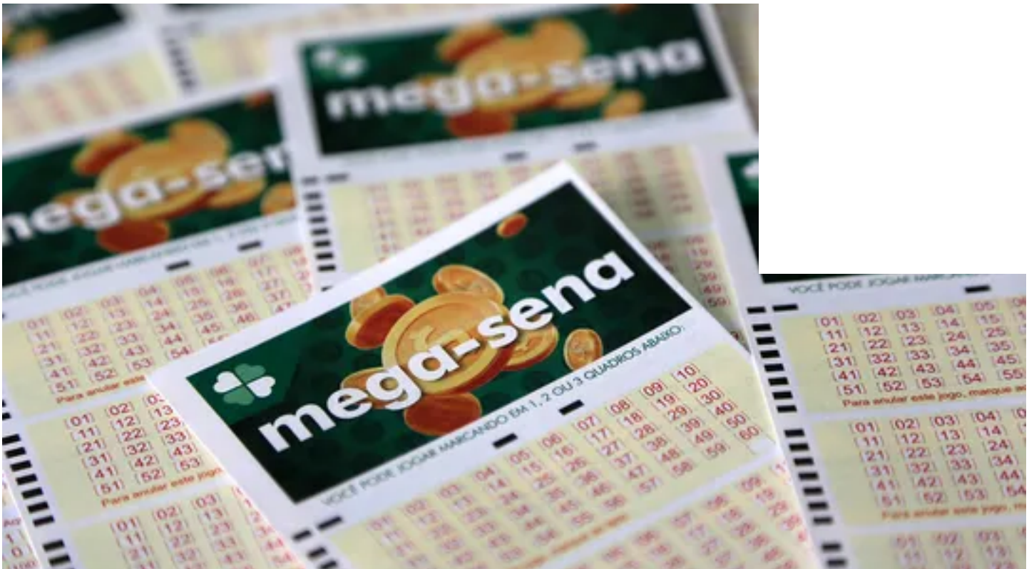
02/08/2023 00:00 — Em Gastar Bem

Apostas podem ser feitas até às 19h do dia do sorteio e o valor de um jogo simples é de R$ 5,00