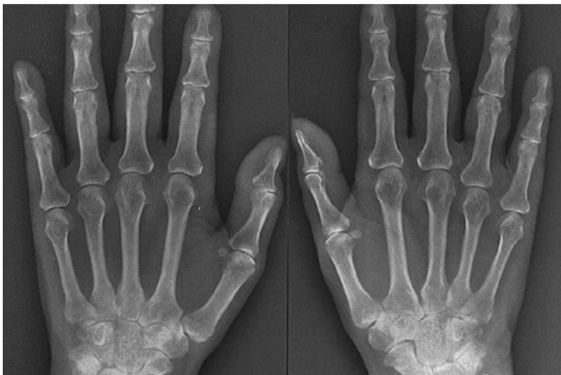
Imagem: radiografia de mãos: aumento de partes moles, osteopenia just-articular, ausência de erosões marginais, ausência de deformidades articulares.