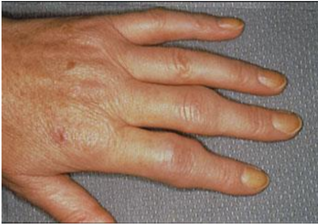
Imagem: fotografia da mão esquerda da paciente, evidenciando o aumento de volume em 2º e 3º articulações interfalangeanas proximais.