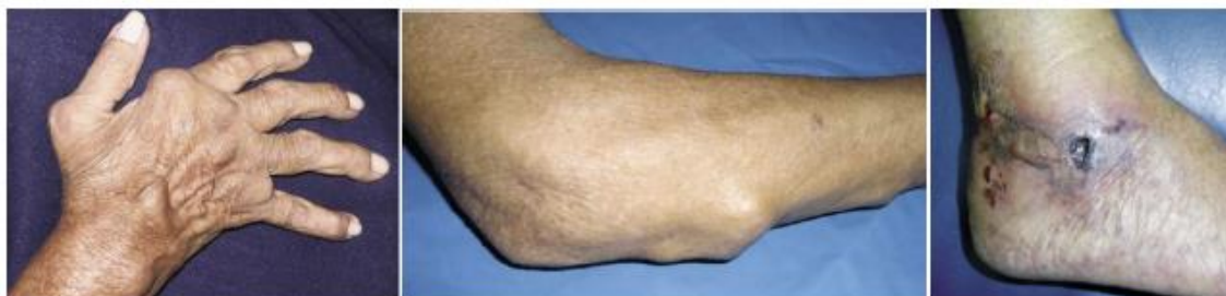
Imagens da paciente: Deformidades em mãos; nódulo reumatoide em antebraço direito; úlcera cutânea em tornozelo (da esquerda para a direita).