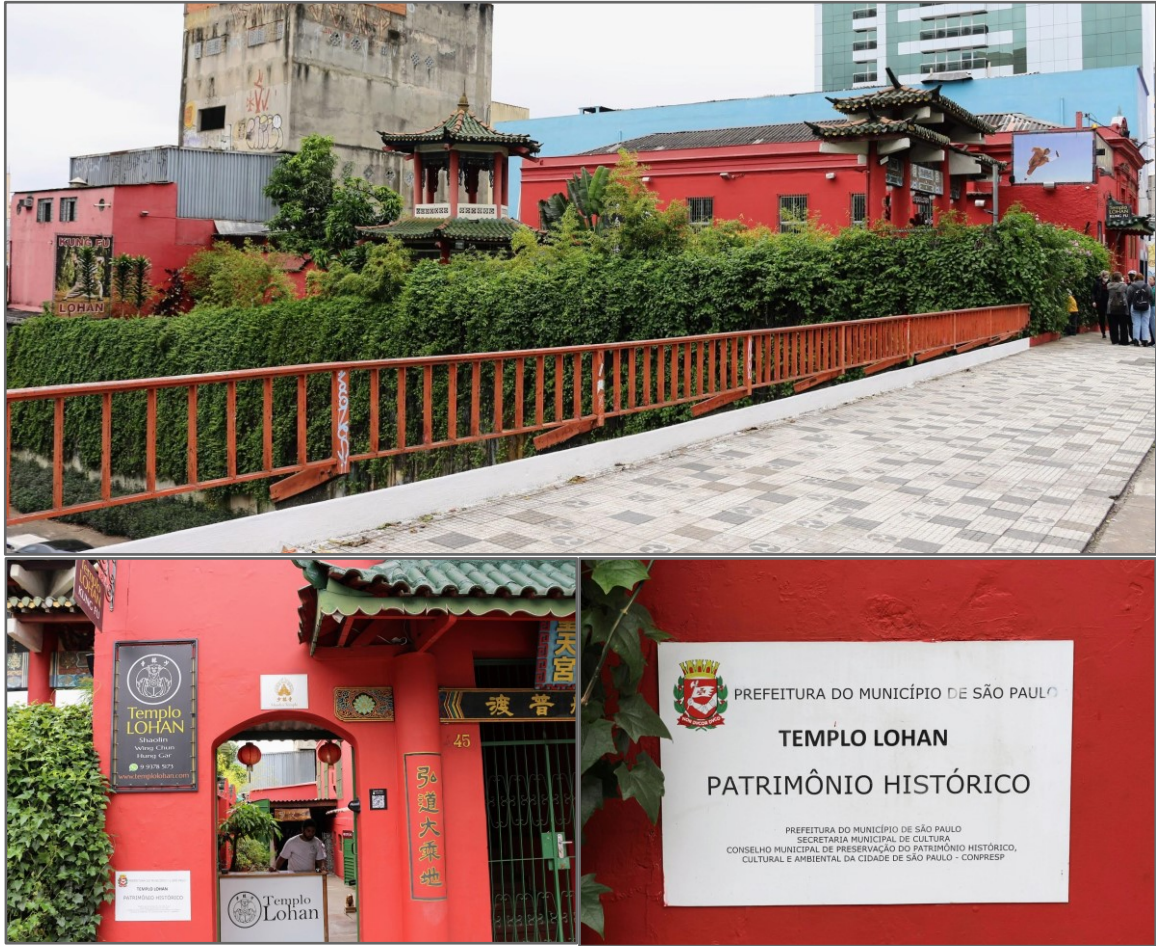
Fotografias de Fabíola Alice dos Anjos Durães, 2022.