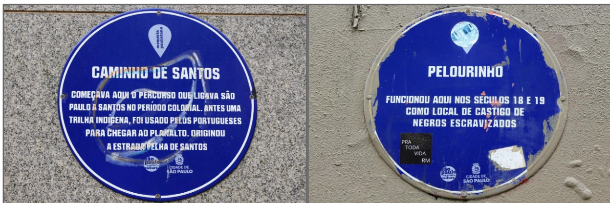
Fotografias de Fabíola Alice dos Anjos Durães, 2022.