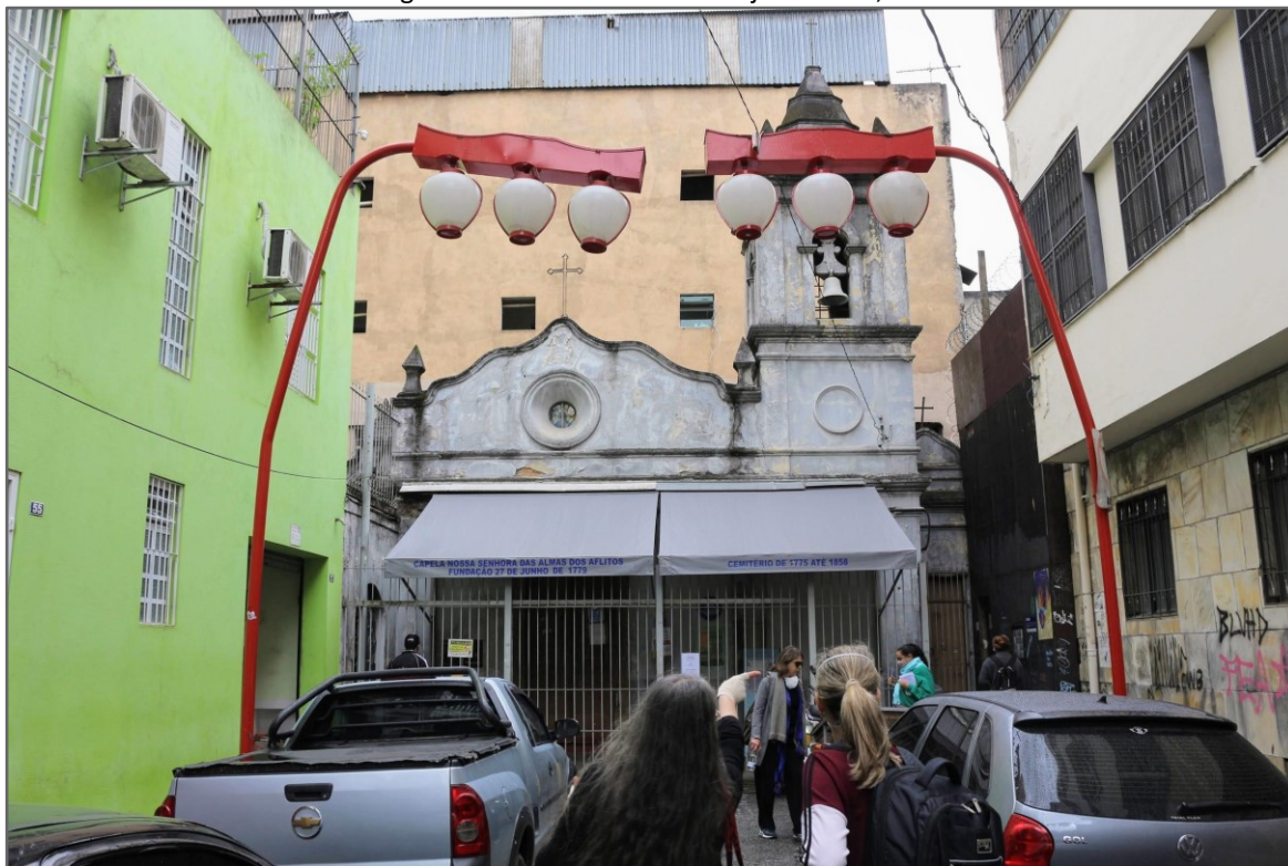
Fotografia de Fabíola Alice dos Anjos Durães, 2022.