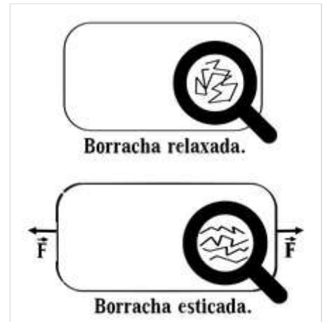
Pedaço de elástico relaxado e distendido, mostrando a cadeia polimérica do material.

Podemos sentir o efeito da entropia ao esticarmos um elástico, por exemplo. A borracha é formada por longas cadeias de polímeros com ligações cruzadas – que lembram zigzagues. Quando o elástico está relaxado essas cadeias estão parcialmente enroladas e ordenadas aleatoriamente, devido a esse alto grau de desordem das moléculas o estado possui um valor de entropia também alto. Ao esticarmos o elástico desenrolamos essas moléculas e as alinhamos, como o alinhamento diminui a desordem isso significa dizer que a derivada dS/dx se torna negativa e conseqüentemente a força exercida pelos polímeros se torna positiva. Essa força se deve a tendência das moléculas de voltar ao estado menos ordenado (com uma maior entropia).