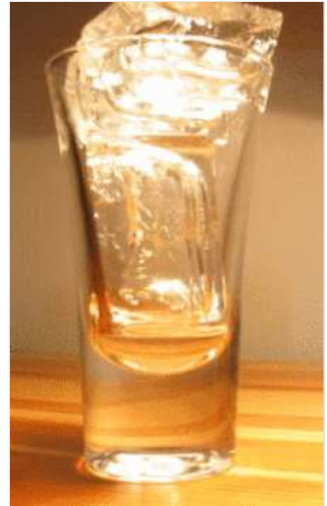
Gelo derretendo: um exemplo clássico de aumento de entropia

A entropia (do grego εντροπία , entropía ), unidade [J/K] (joules por kelvin), é uma grandeza termodinâmica que mede o grau de liberdade molecular de um sistema, [1] e está associado ao seu número de configurações (ou microestados ), ou seja, de quantas maneiras as partículas (átomos, íons ou moléculas) podem se distribuir em níveis energéticos quantizados, incluindo translacionais, vibracionais, rotacionais, e eletrônicos. Entropia também é geralmente associada a aleatoriedade, dispersão de matéria e energia, e "desordem" (não em senso comum) [Nota 1] de um sistema termodinâmico. A entropia é a entidade física que rege a segunda lei da termodinâmica, a qual estabelece que a ela deve aumentar para processos espontâneos e em sistemas isolados. Para sistemas abertos, deve-se estabelecer que a entropia do universo (sistema e suas vizinhanças) deve aumentar devido ao processo espontâneo até o meio formado por sistema + vizinhanças atingir um valor máximo no estado de equilíbrio. Nesse ponto, é importante ressaltar que vizinhanças se entende como a parte do resto do universo capaz de interagir com o sistema, através de, por exemplo, trocas de calor. [2]