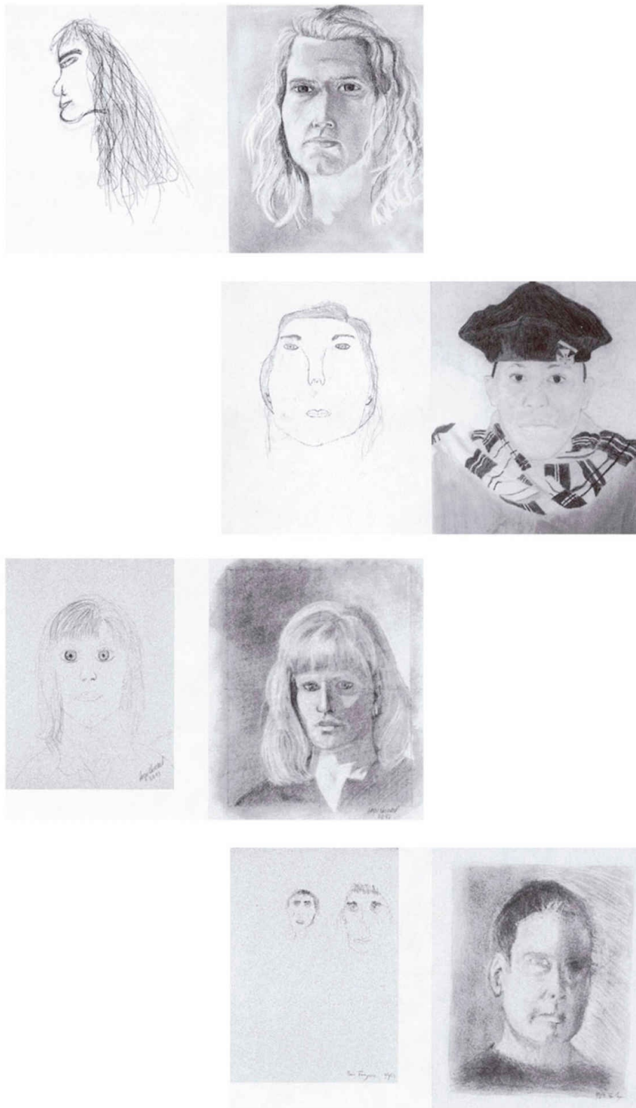
“Drawings from the five-day seattle class” de THE NEW DRAWING ON THE RIGHT SIDE OF THE BRAIN: A COURSE IN ENHANCING CREATIVITY AND ARTISTIC CONFIDENCE, copyright © 1979, 1989, 1999 by Betty Edwards. Usada com permissão da Tarcher, um selo da Penguin Publishing Group, uma divisão da Penguin Random House LLC. Todos os direitos reservados.

Os resultados são fantásticos. No começo, essas pessoas não pareciam ter muita habilidade artística. A maior parte das figuras que desenhavam lembrava a minha coruja. Mas poucos dias depois já eram capazes de desenhar de verdade! E Edwards jura que é sempre assim. Parece impossível.