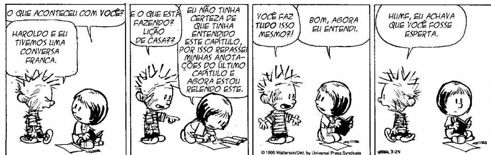
Calvin & Hobbes, Bill Watterson

O problema é que essas histórias reduziam a questão a opções excludentes. Ou você tem capacidade ou confia no esforço. E isso faz parte do mindset fixo. O esforço é para aqueles que não têm capacidade. As pessoas de mindset fixo nos dizem: “Se você tiver de se esforçar em alguma coisa, é porque não tem capacidade para fazê-la bem-feita”. E acrescentam: “As coisas são mais fáceis para aqueles que são geniais de verdade”.