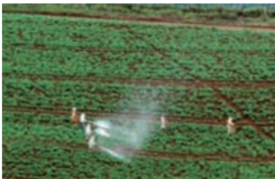
Figura 2a. Cultivo convencional de batata, utilizando pulverização com mangueira (2006).