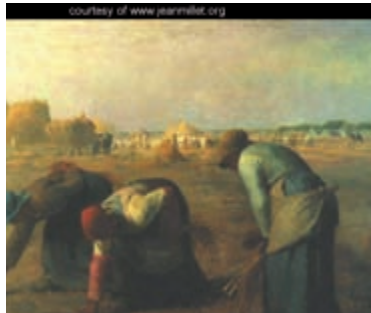
Figura 1. Quadro de Jean Millet mostrando a agricultura no século 18

Aliadas a outras práticas agrícolas, como o uso de variedades melhoradas, irrigação, uso intensivo de insumos industriais, sobretudo os fertilizantes químicos e os agrotóxicos, e uso intensivo de máquinas agrícolas no preparo do solo caracterizaram a chamada " Revolução Verde ". Este modelo produtivo que vem sendo praticado nas últimas décadas é, também, chamado de agricultura convencional .