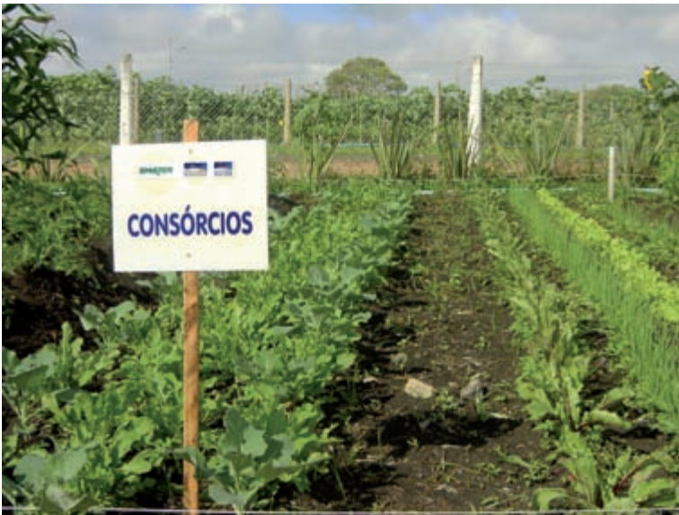
Figura 15. Área experimental – consórcio de plantas hortícolas. CPRA-Centro Paranaense de Referência em Agroecologia.

Por meio da associação ou consórcio de plantas companheiras é possível obter efeitos positivos, com aumento da produtividade e manutenção da qualidade do solo.