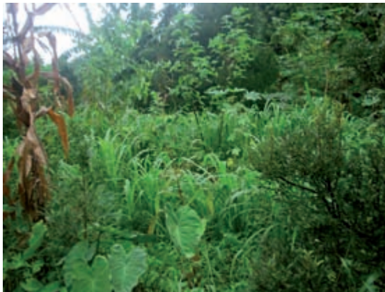
Figura 16. Implantação de Sistema Agroflorestal no Sítio Catavento. Na foto, destaque para os itens alimentares: milho, taioba e banana. Proprietário: Fernando Ataliba.

√ A possibilidade de recuperação de áreas degradadas e áreas prioritárias na preservação da biodiversidade, que são de maior fragilidade ambiental e, na maioria das vezes, ocupadas por agricultores familiares. A atividade agrícola convencional nessas áreas traz consequências desastrosas para a sustentabilidade agrícola .