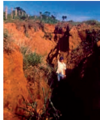
Figura 4. Voçoroca em áreas inicialmente cobertas com pastagem no Pontal do Paranapanema, SP. Foto: P. Espíndola Trani, 1995