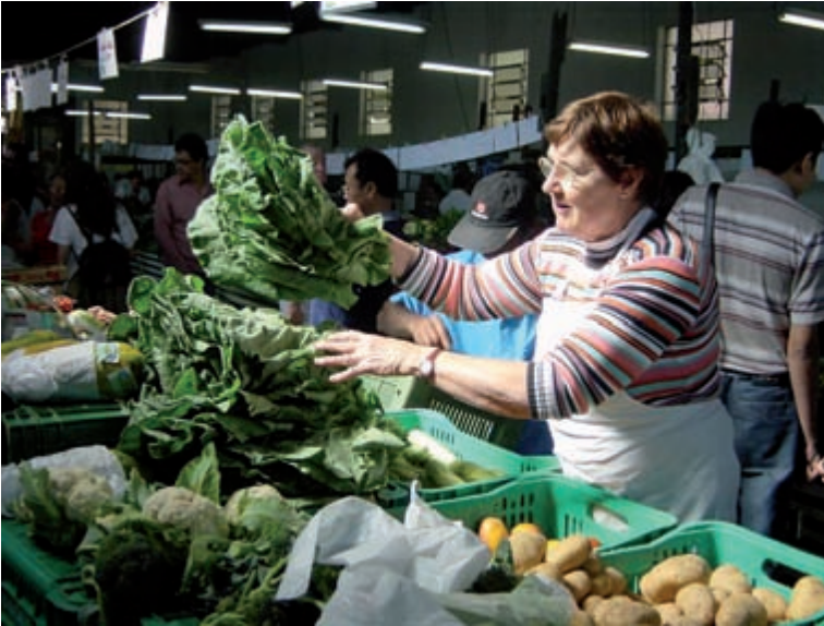
Figura 18. Banca dos irmãos Roncáglio. Feira Orgânica da AAO-Parque da Água Branca.

to de encontro de pessoas ligadas a temas afins, como o meio ambiente, a saúde e a responsabilidade social.