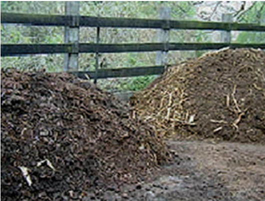
Figura 10. Resíduo orgânico gerado pela produção animal para ser compostado e posteriormente utilizado na agricultura. Sítio Duas Cachoeiras. Amparo/SP.

Existem vários tipos de adubos orgânicos de uso recomendável na agroecologia. Em geral, deve-se atentar para a origem e qualidade. Não é permitido, por exemplo, o uso de adubos oriundos de lixo urbano devido à probabilidade da presença de contaminantes.