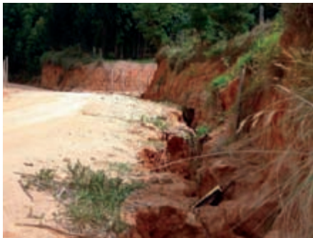
Figura 3. Perigosa vala de erosão em estrada rural municipal, em Campinas, SP.