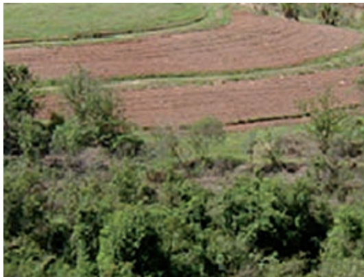
Figura 9. Práticas mecânicas (terraços e plantio em nível) e vegetativas (florestamento) integradas no Sítio Duas cachoeiras, Amparo/SP.

Ao adotar práticas de conservação do solo e água, o produtor agroecológico propicia a recuperação e manutenção da fertilidade do solo, o equilíbrio dos ecossistemas agrícolas e diminui ou evita a ocorrência de erosão.