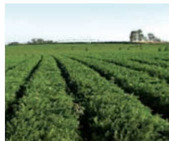
Figura 2b. Cultivo convencional de cenoura (2006).