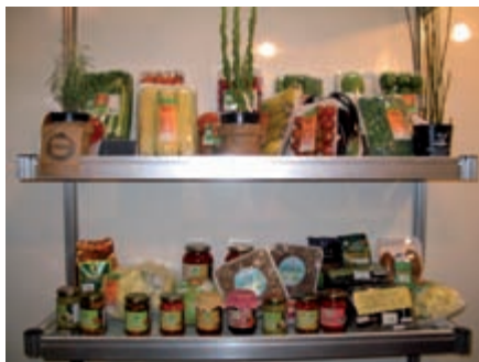
Figura 17. Comercialização de produtos orgânicos em feiras especializadas

Em contrapartida, alguns movimentos ligados a agricultura familiar têm se mostrado preocupados com esta tendência e com a possível eliminação do agricultor familiar orgânico deste mercado.