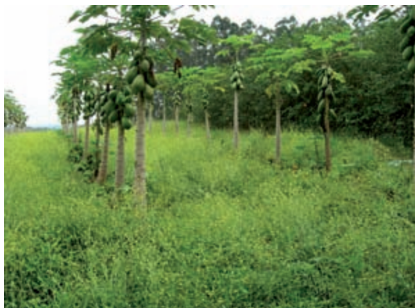
Figura 12. Pomar orgânico (mamão), com adubação verde (nabisco) Sítio Catavento-Indaiatuba/SP.