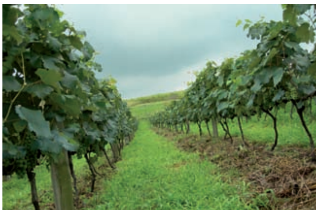
Figura 11. Cultivo de uva orgânica com boa cobertura do solo. Sítio Catavento-Indaiatuba/SP.

recer a infiltração de água no perfil do solo, evitar as altas temperaturas provocadas pela incidência direta dos raios solares e contribuir para o controle de plantas espontâneas.