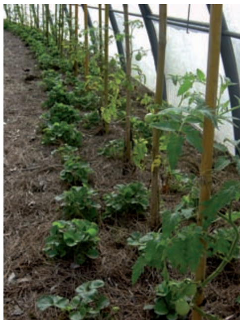
Figura 14. Tomate e morango orgânicos são cultivados em ambiente protegidos. CPRA-Centro Paranaense de Referência em Agroecologia.

As plantas antagônicas são aquelas com capacidade de inibir o crescimento e o desenvolvimento de outras, por meio da liberação de certas substâncias no ambiente (solo, ar). Exemplo: tomate e batata.