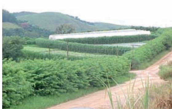
Figura 7. Uso de quebra-ventos em produção orgânica de hortaliças na Fazenda Nata da Serra - Serra Negra/SP.

As práticas de caráter vegetativo são aquelas que utilizam a vegetação, de forma racional, para defender o solo contra a erosão. Alguns exemplos: florestamento, reflorestamento, plantas de cobertura, cultura em faixas, quebra-ventos.