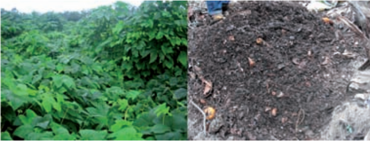
Figura 8a. Adubação verde com a espécie mucuna. Figura 8b. Composto orgânico. Sítio Catavento - Indaiatuba/SP. Proprietário: Fernando Ataliba.

da e facilitar-lhe a infiltração no solo. Exemplos: distribuição racional dos caminhos, terraceamento e plantio em nível, caixas de contenção, canais escoadouros.