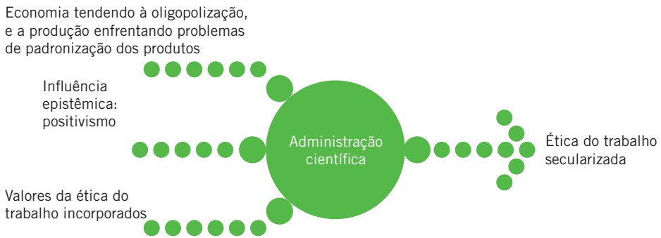
Figura 1.1 A secularização 6 da ética do trabalho (concepção do trabalho sob o capitalismo tradicional).

contribuições consistiram em inovações tecnológicas (mecanização) e econômicas (produção em massa afetando as normas de consumo e de vida), tendo desdobramentos tanto na organização do trabalho quanto na gestão de pessoal (Leite, 1994; Neffa, 1990).