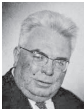
David Rousset (1912-1997) France.