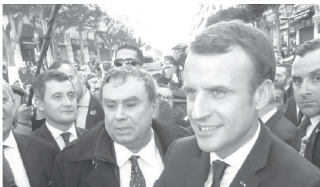
Benjamin Stora, « L'homme qui murmure à l'oreille du président. »

N ommé par Manuel Valls « président de la Cité de l'immigration » en 2014, Benjamin Stora n'est pas un ingrat. Macron au pouvoir, il s'est affiché à ses côtés lors d'un récent voyage en Algérie. Sur le site de France Info, on le présente ainsi à propos d'une interview en date du 5 décembre dernier : « L'homme qui murmure à l'oreille du Président (...) » Diable ! Ne faudrait-il pas dire plutôt : « L'homme que le président tient par l'oreille » ? Que dire en effet de l'indépendance d'un « historien » qui se fait vertu de rendre hommage aux immigrés d'hier tout en s'associant avec un chef d'État qui organise la chasse aux immigrés d'aujourd'hui (rebaptisés migrants) avec une violence sans précédent depuis Vichy ?