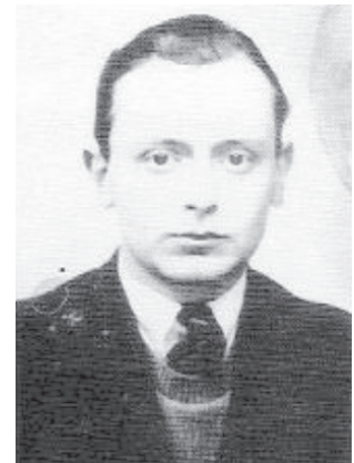
Zborowski dit Etienne. Agent de la Guépéou infiltré auprès de Léon Sédov.

La conférence, ainsi préparée sous la pression permanente de la police politique stalinienne, au courant de tout puisque le délégué de la section soviétique n'est autre qu'un de ses agents, Etienne, celui-là même qui a organisé l'assassinat de Léon Sédov, se tient dans la précipitation, en une seule journée, le 3 septembre 1938, dans une ferme de Périgny (« la grange », appartenant à Alfred Rosmer), en banlieue parisienne.