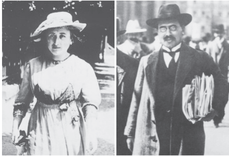
Rosa Luxemburg et Karl Liebknecht.