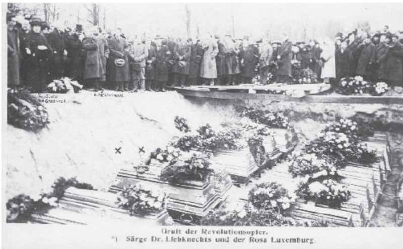
Les funérailles de Rosa Luxemburg et Karl Liebknecht.