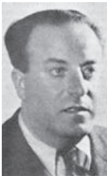
Ignace Reiss, agent de la Guépéou, avait décidé de rejoindre la IV e Internationale. Staline l'a fait assassiner.

Pour des raisons de sécurité, cette conférence de Périgny fut appelée « conférence de Lausanne ».