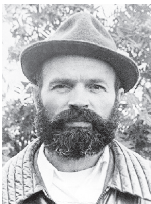
Anatoli Martchenko (1938-1986).

Libéré au début de 1967, il se lance dans la rédaction d'un livre sur les camps de l'époque Khrouchtchev puis Brejnev,