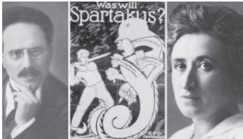
Karl Liebknecht et Rosa Luxemburg encadrant une affiche de propagande du KPD (Parti communiste d'Allemagne) fondé le 30 décembre 1918.