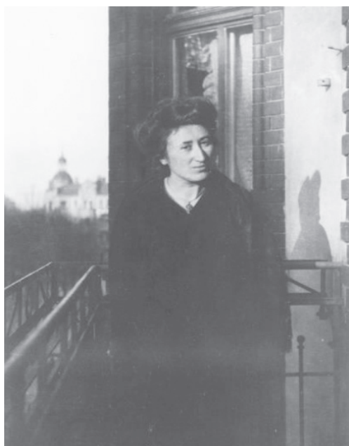
Rosa Luxemburg vue d'un balcon.

Dernier écrit de Rosa Luxemburg, 14 janvier 1919