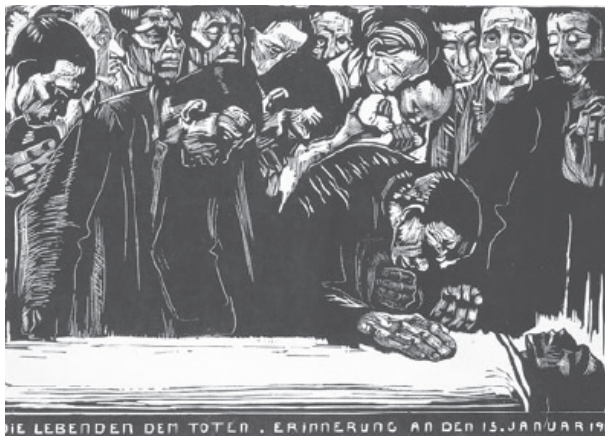
La mort de Karl Liebknecht, par l'artiste berlinoise Käthe Kollwitz..