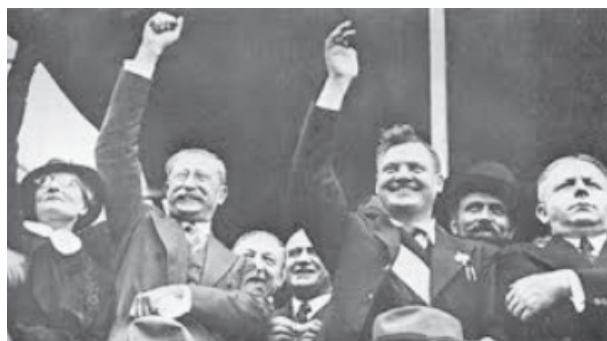
À la tribune, Blum (PS-SFIO), à gauche, et Thorez (PCF), au centre, Daladier, à droite, qui fera voter en 1938 les décrets-lois attaquant les 40 heures !

Le 20 juin 1937, le gouvernement Blum tombe. La même Chambre des