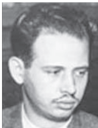
Max Schachtman (1904-1972) États-Unis.