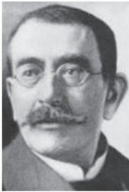
Gustav Noske, ministre SPD de la guerre du gouvernement Scheidemann. Se dit « le chien sanguinaire ».

d'intégrer les cadres de l'avant-garde révolutionnaire berlinoise. Jogiches en tirait argument pour sa thèse : sa formation était prématurée. Le changement de titre de Spartacus n'avait rien apporté à la classe ouvrière allemande, qui avait besoin d'une direction révolutionnaire dont les Délégués devaient être partie intégrante.