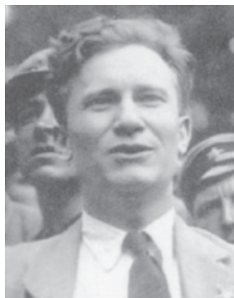
James P. Cannon (1890-1974) États-Unis.