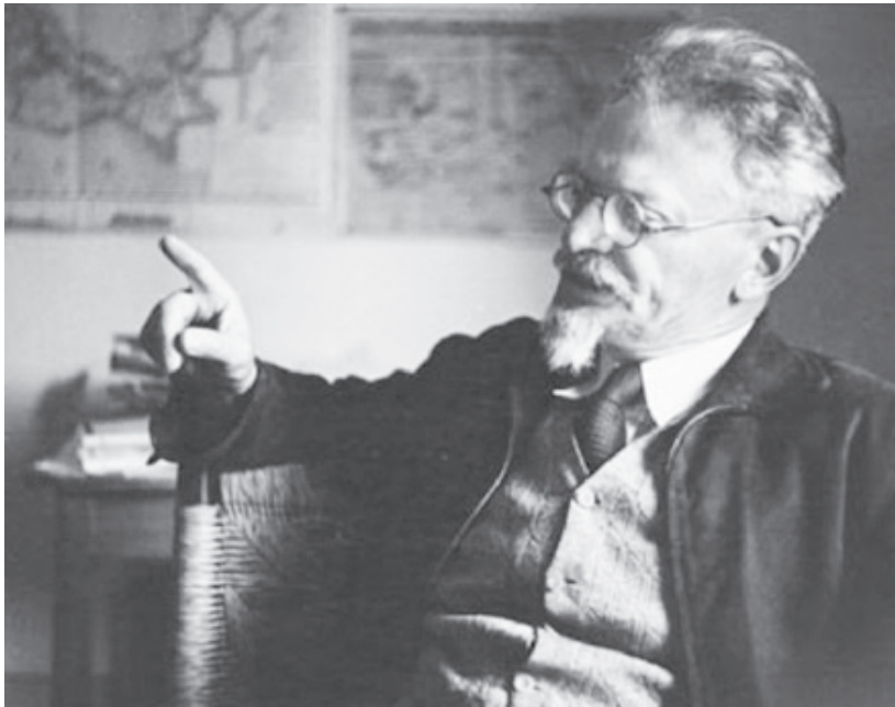
Léon Trotsky en 1938.