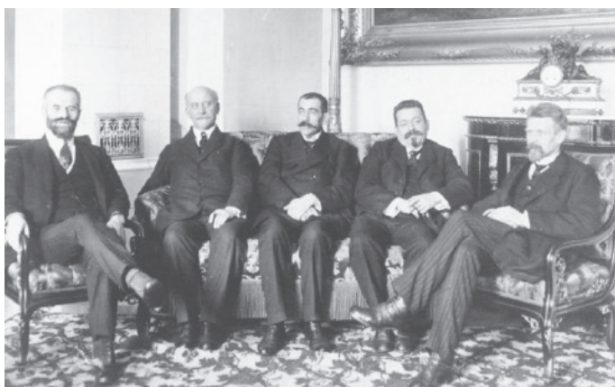
Le gouvernement du « conseil des commissaires du peuple ». De gauche à droite : Otto Landsberg, Philipp Scheidemann, Gustav Noske, Friedrich Ebert et Rudolf Wissell.

Désigné comme chancelier du Reich par le dernier chancelier de l'empire, le prince Max de Bade, le socialiste majoritaire Ebert se tourne aussitôt vers les Indépendants dont l'aile gauche a été l'aile marchante de la révolution de novembre, et leur offre le partage du pouvoir. De longues discussions dans la journée et la soirée du 9 novembre aboutissent à un compromis : six « commissaires du peuple », trois majoritaires et trois Indépendants, sont investis de pouvoirs dont on a pu dire qu'ils faisaient d'eux, collectivement, à la fois le chancelier et le président du Reich.