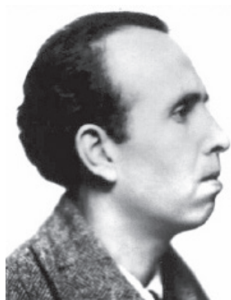
Michel Raptis, dit Pablo (1911-1996) - Grèce.