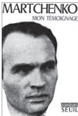
La couverture du livre « Mon témoignage » d'Anatoli Martchenko. ( Le Seuil 1970).

Lettre d'Anatoli Martchenko aux journaux Rude Pravo , Literarni Listy , Prace . Copie à L'Humanité , à L'Unita , au Morning Star et à la BBC.