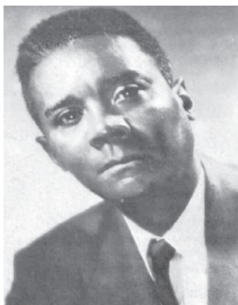
C.L.R. James (1901-1989) Royaume-Uni.