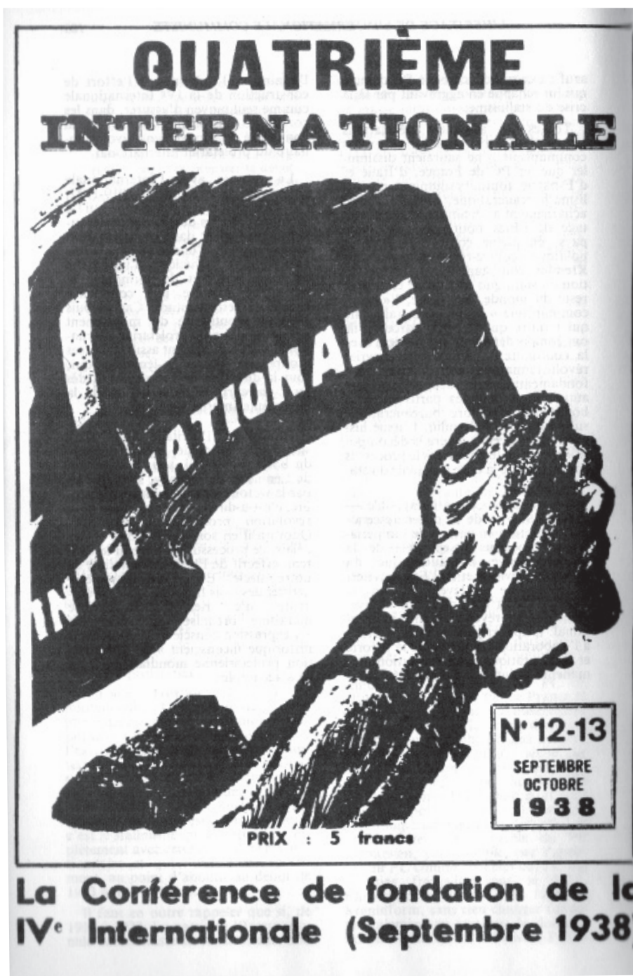
Première page de la Vérité numéros 12 et 13 de septembre-octobre 1938, rendant compte de la conférence de fondation de la IV e Internationale.