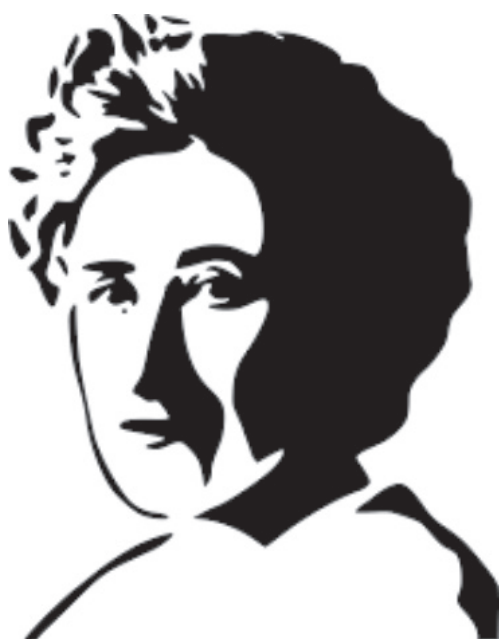
Rosa Luxemburg en profil.

C 'est en ces termes qu'est formulé le deuxième point de l'ordre du jour du Congrès des conseils d'ouvriers et de soldats, et c'est en effet la question cardinale de la révolution dans le moment présent.