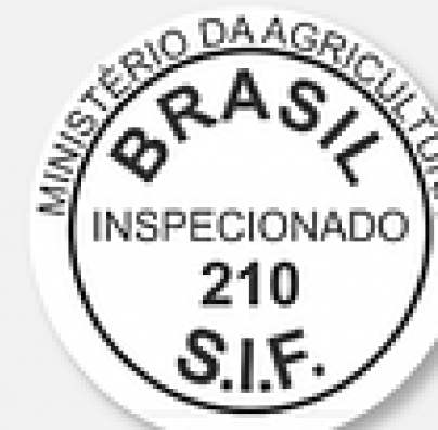
SIF (Selo de Inspeção Federal)