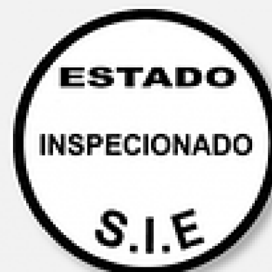
SIE (Selo de Inspeção Estadual)