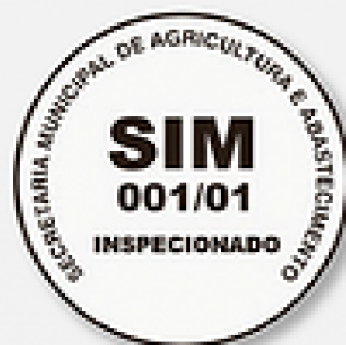
SIM (Selo de Inspeção Municipal)

Garantia da qualidade dos produtos de origem animal destinados à alimentação ou não, assegurando as condições sanitárias e condições físico-químicas do produto, a nível nacional, estadual e municipal.