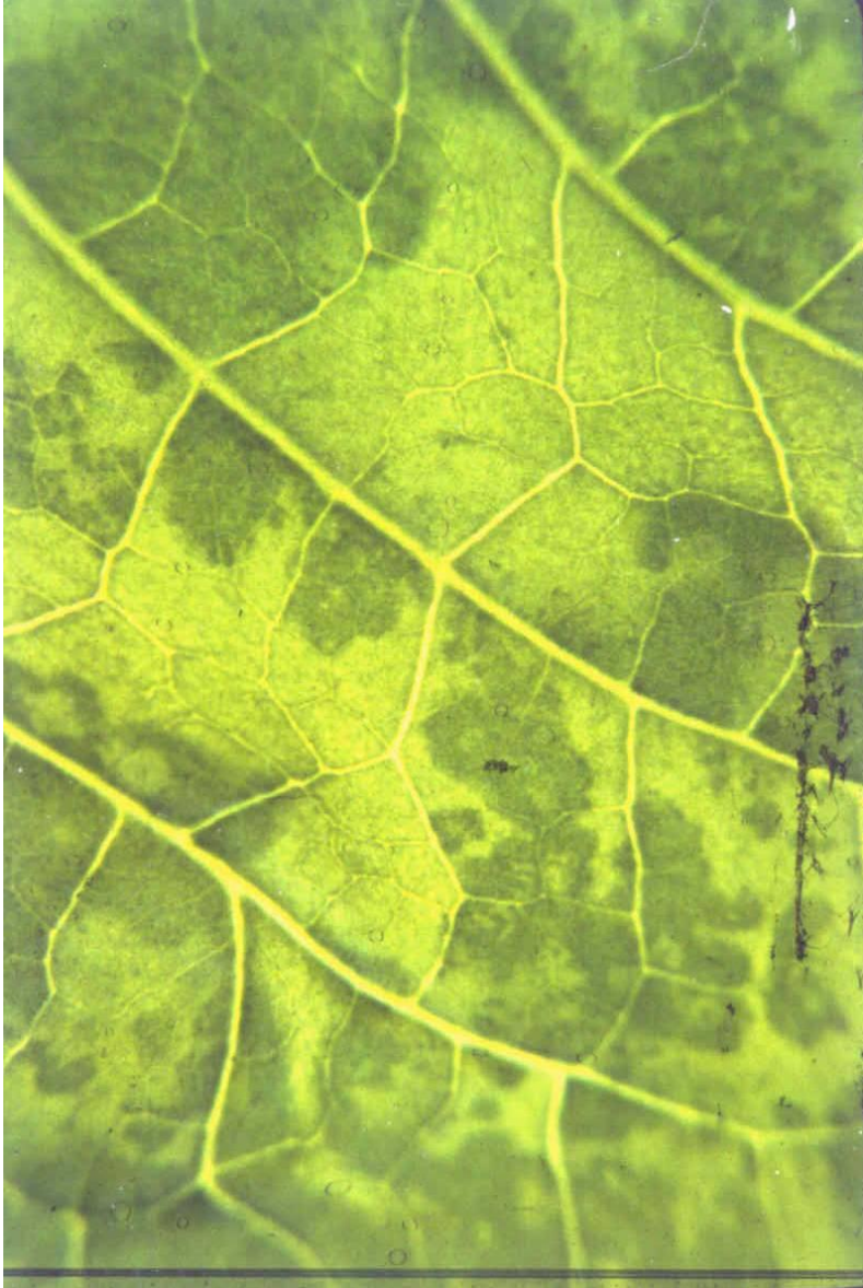
Mosaico do fumo - TMV

Laboratório de Virologia Vegetal Esalq | USP