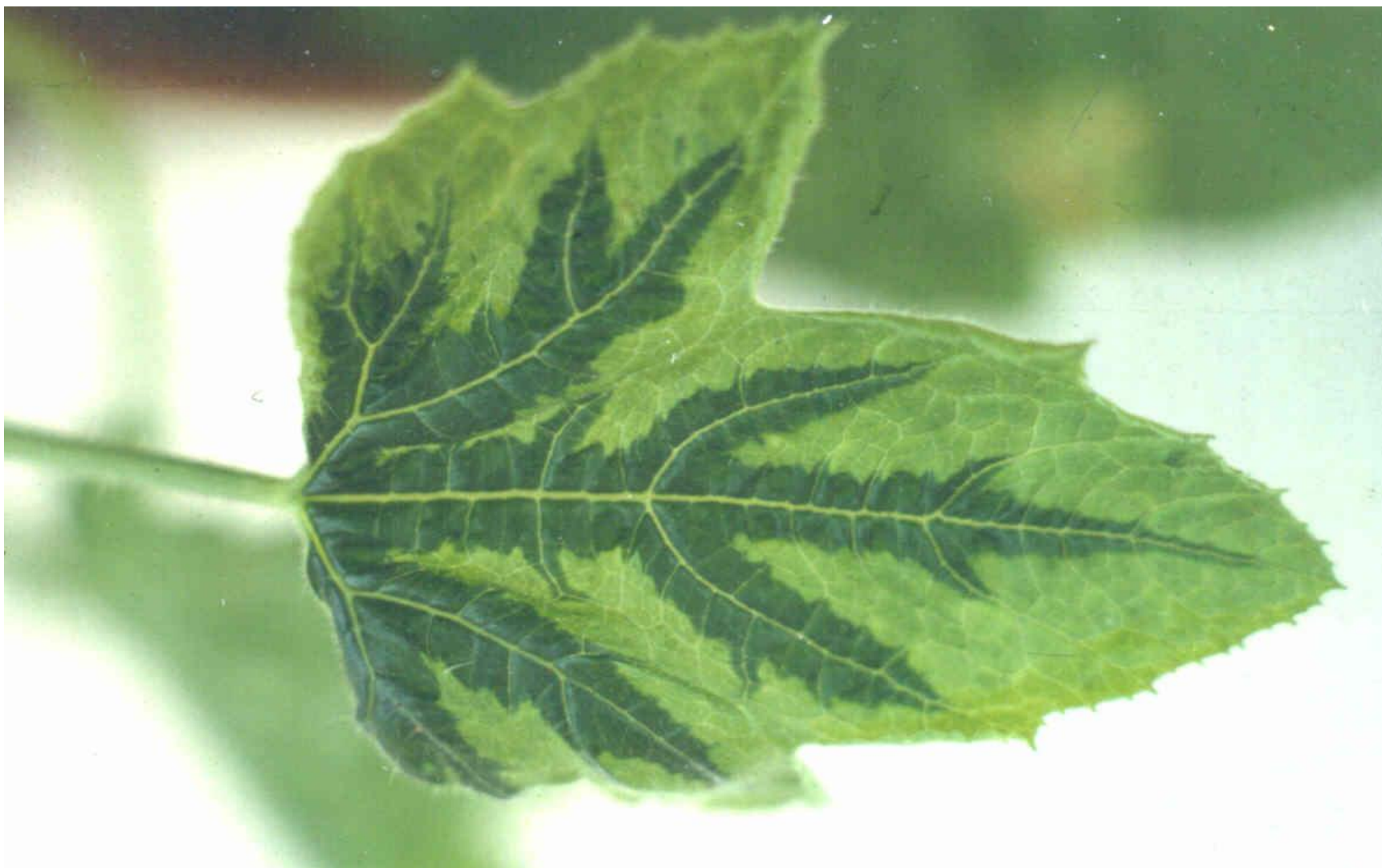
Mosaico amarelo da abobrinha - ZYMV

Laboratório de Virologia Vegetal Esalq | USP