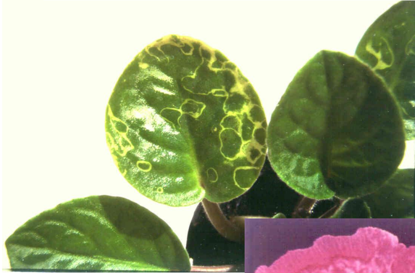
Choque térmico em violeta Africana