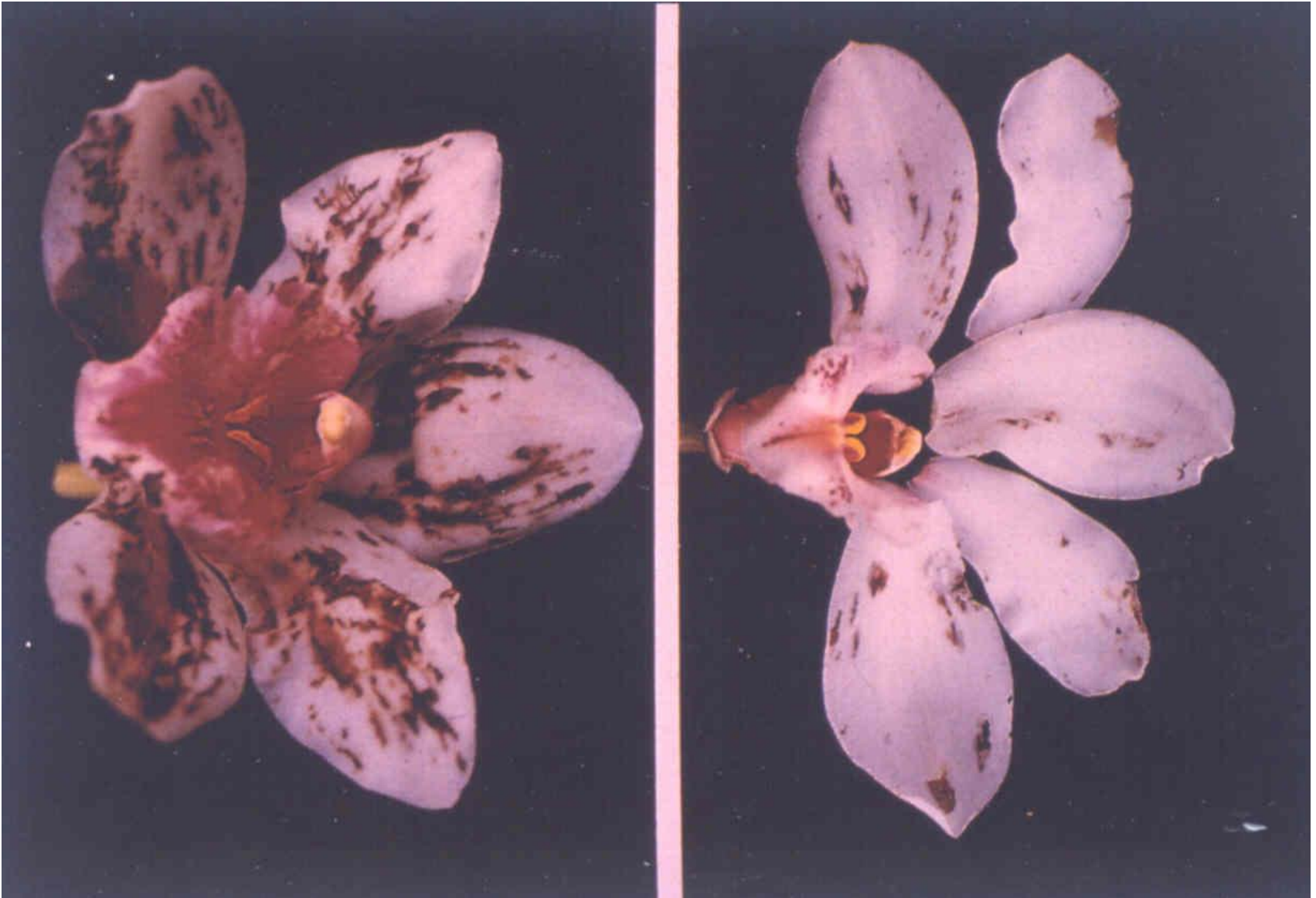
Odontoglossum ringspot virus

Laboratório de Virologia Vegetal Esalq | USP