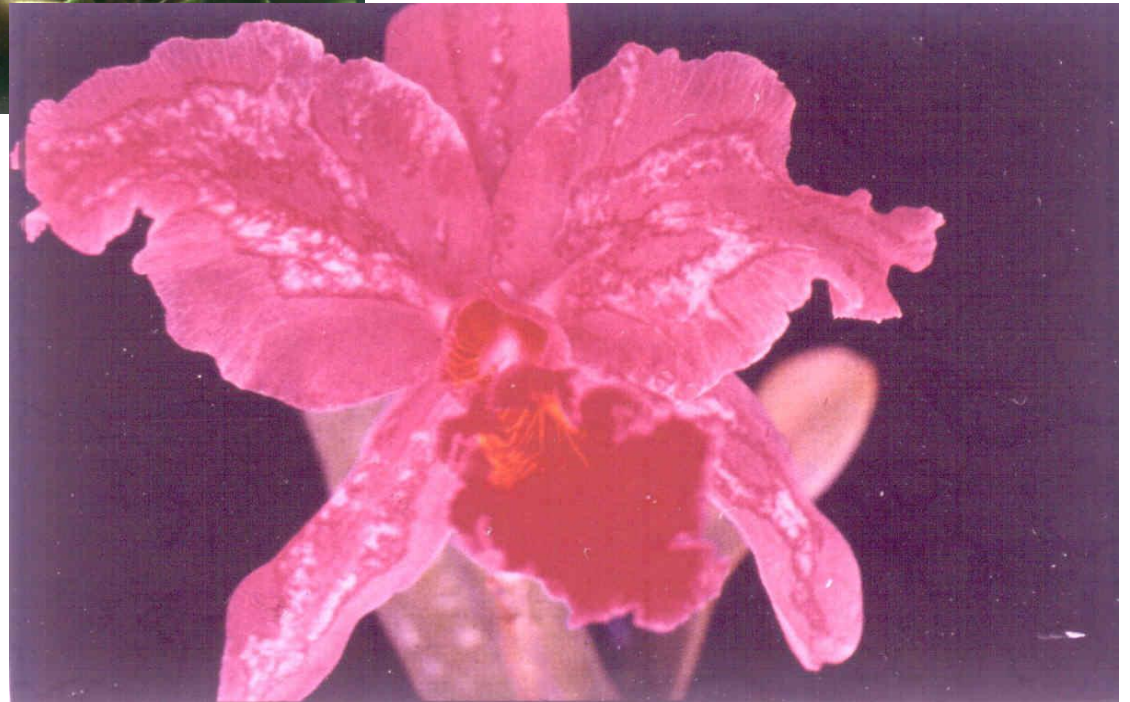
Baixa temperatura em orquídea