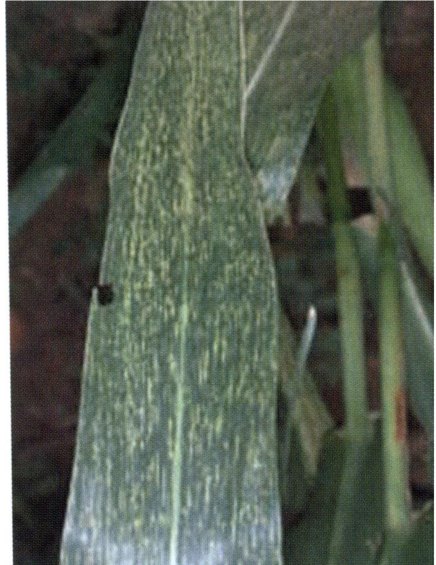
Maize streak virus