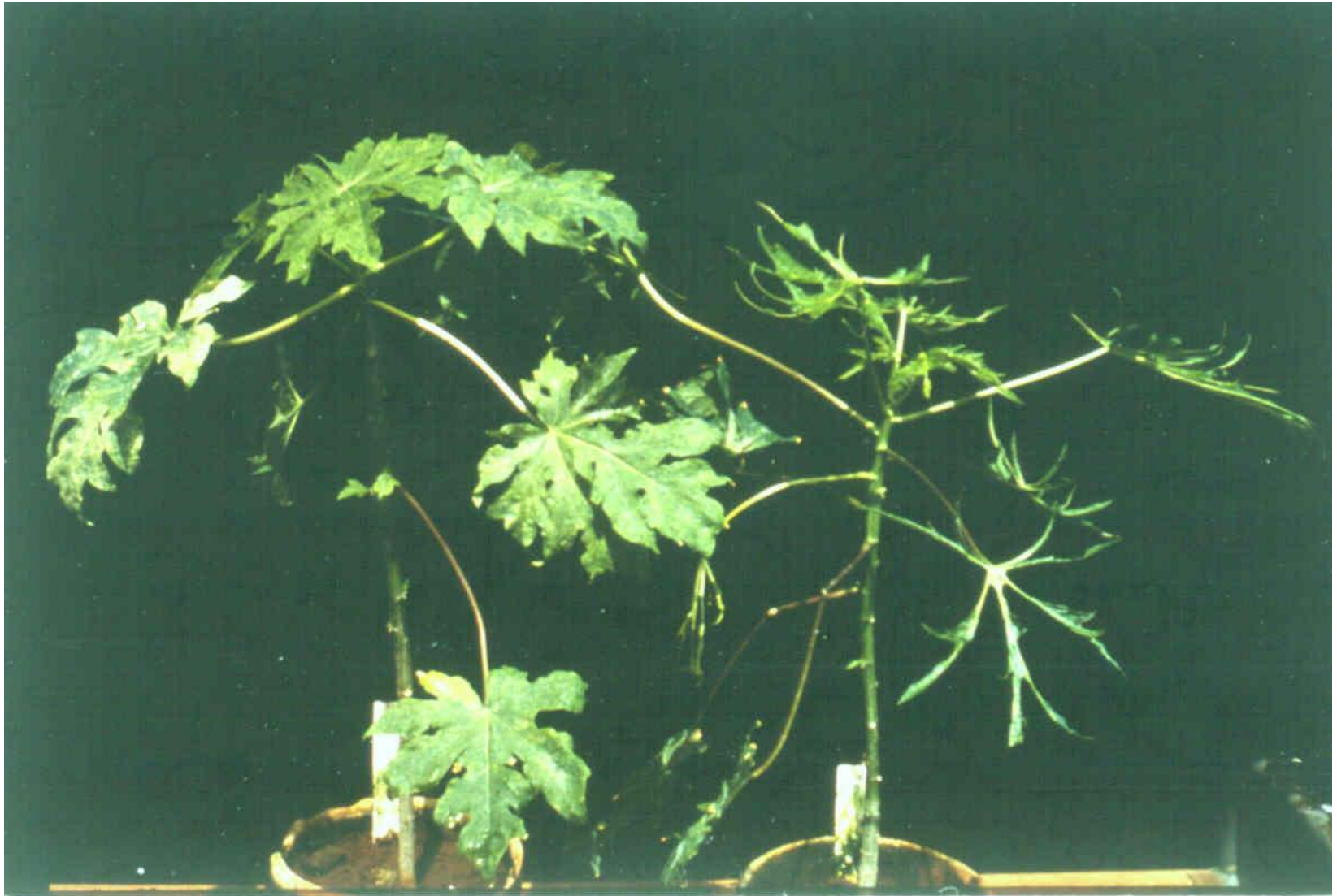
Cordão de sapato – PRSV-P em mamoeiro

Laboratório de Virologia Vegetal Esalq | USP