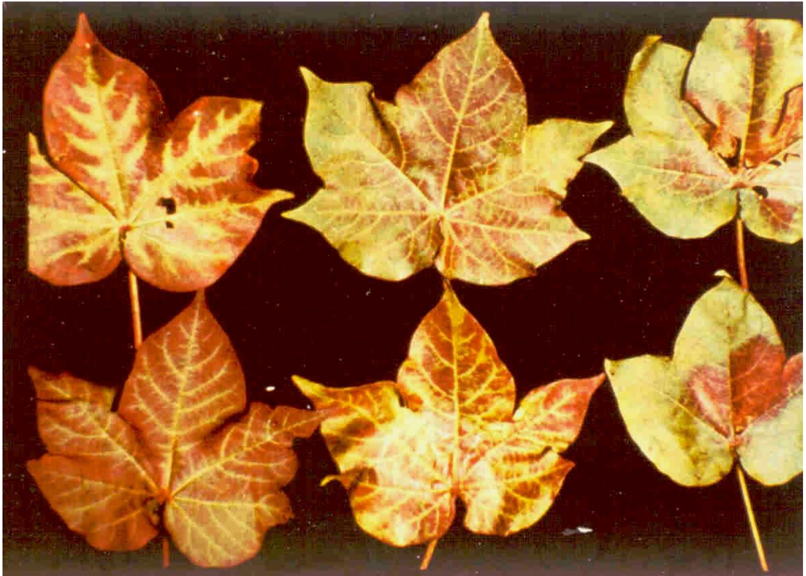
Deficiência de Mg

Laboratório de Virologia Vegetal Esalq | USP