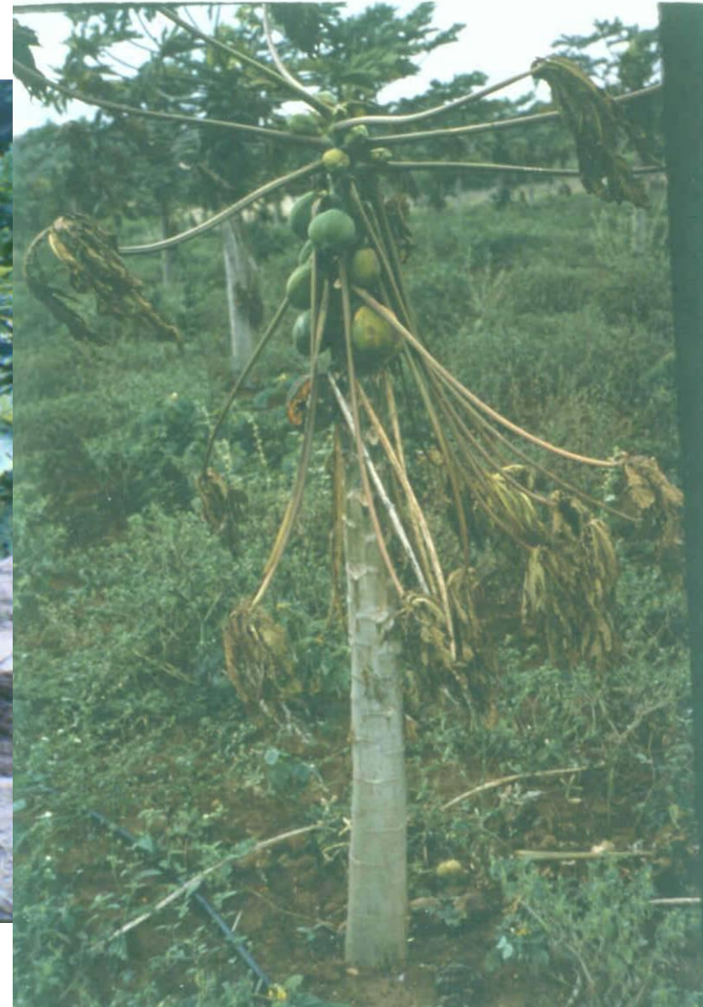
Amarelo letal do mamoeiro Solo