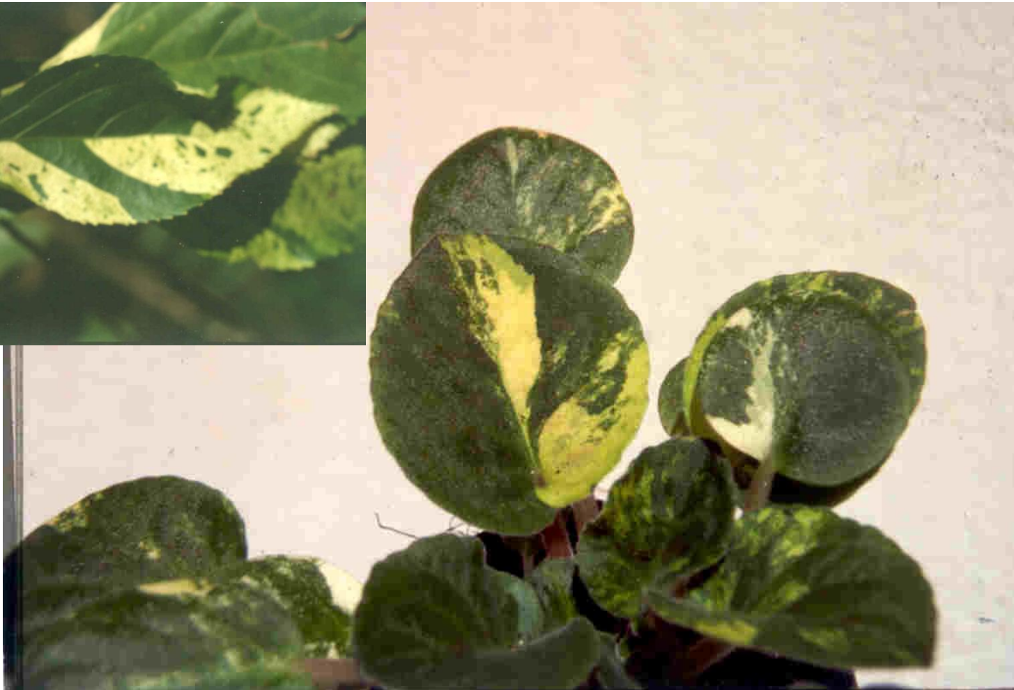
Variação genética em violeta Africana