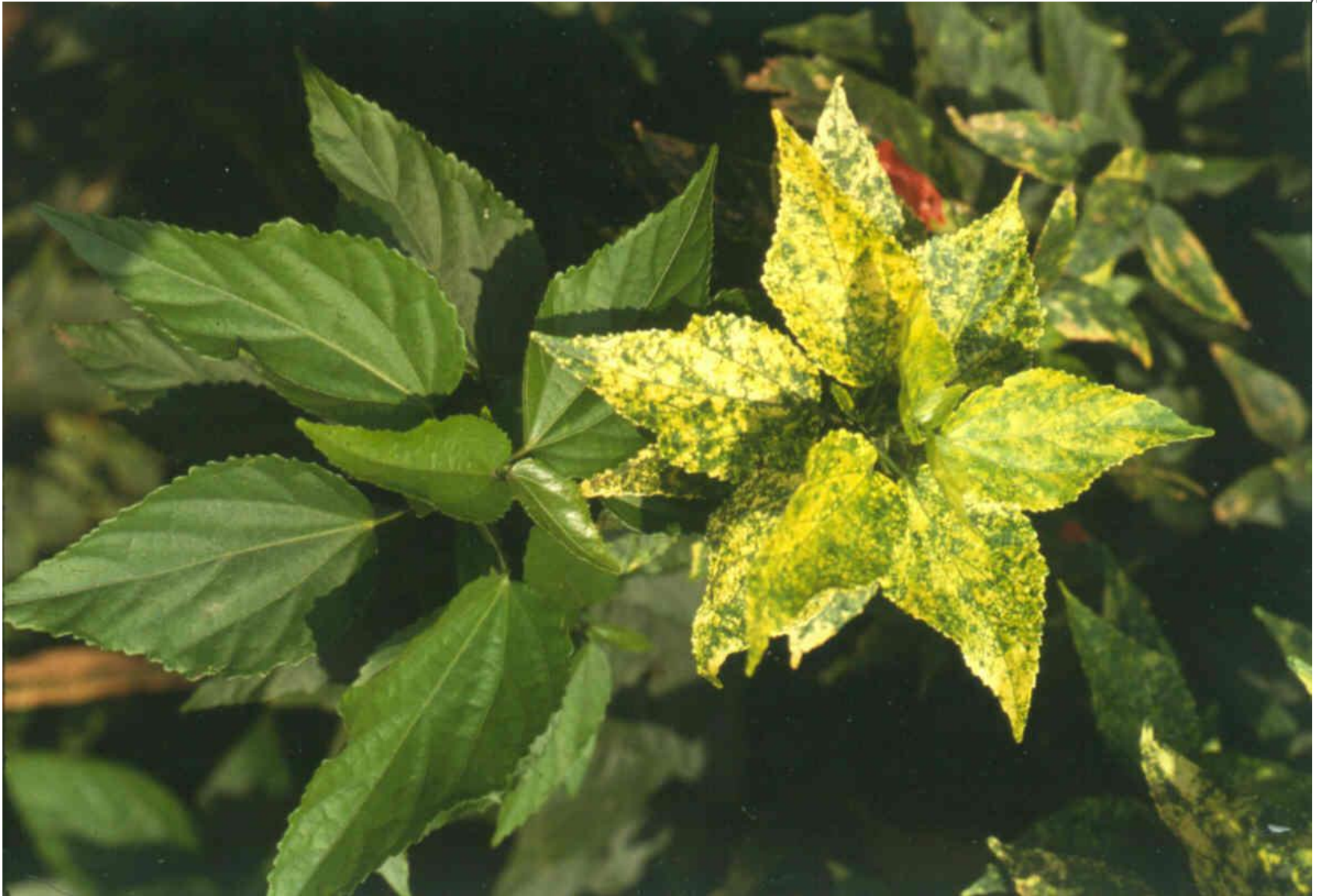
Mosaico dourado em Malvaviscos sp

Laboratório de Virologia Vegetal Esalq | USP