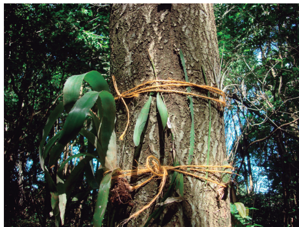
Figura 2: Transplante de epífitas a tronco de forófito. Iracemápolis, SP, Brasil.

As análises foram embasadas em Gotelli & Ellison (2012) e realizadas no software R (R Development Core Team 2011).