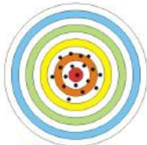
Alta exatidão Baixa precisão