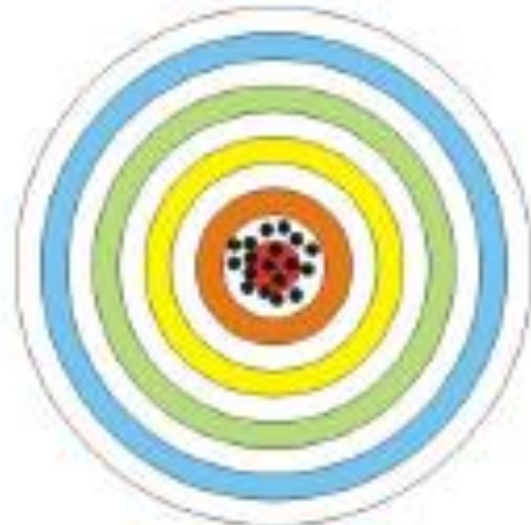
Alta exatidão Alta precisão