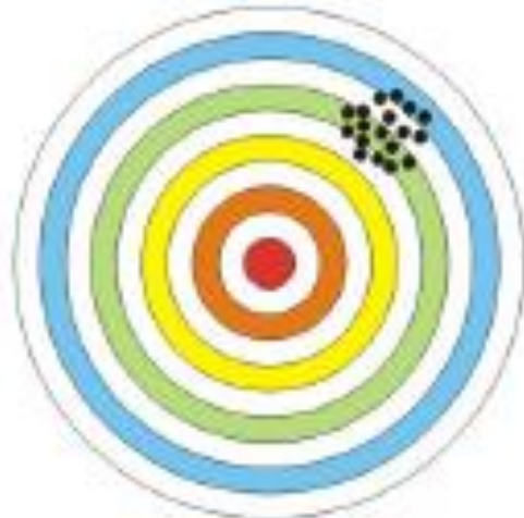
Baixa exatidão Alta precisão