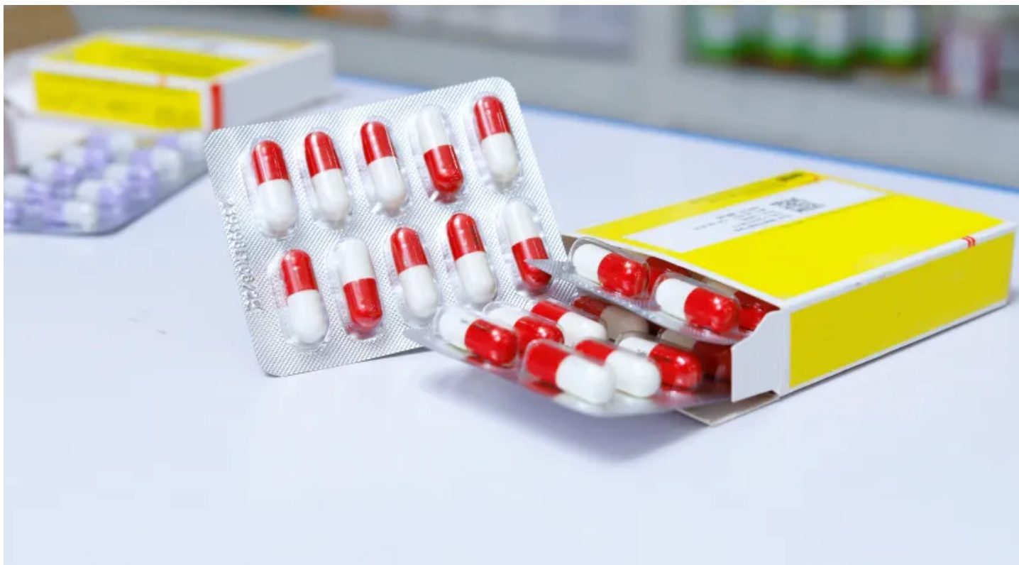
Parcela gratuita do Farmácia Popular é voltada para medicamentos de asma, hipertensão e diabetes

Já as emendas de relator incluídas no orçamento da saúde cresceram 22%