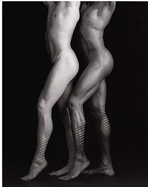
Ken and Tyler, 1985, Platinum print, edition 2/3, 64x56cm, Guggenheim Museum, New York

A plasticidade das imagens monocromáticas de Robert Mapplethorpe se estabelece numa forte conexão com a materialidade, com a fotogenia, “a faculdade da fotografia para sugerir a experiência perceptiva para além da experiência do objeto fotografado”, o que estabelece uma forte conexão com o plano da expressão e provoca certo abalo na aparente pregnância do referente corpóreo e da carga de seu conteúdo, o que diz da força do enunciado ele subverte ao propor uma superfície própria, uma inversão. Obsessivo por composições equilibradas e simétricas propunha uma estética formalmente clássica e conceitualmente barroca. A luz controlada e dramática, uma definição realística fundamenta a materialidade de suas imagens. Mapplethorpe construía fragmentos, transformando corpos humanos e flores em formas escultóricas, sua luz envolvia as formas e lhes dava volume.