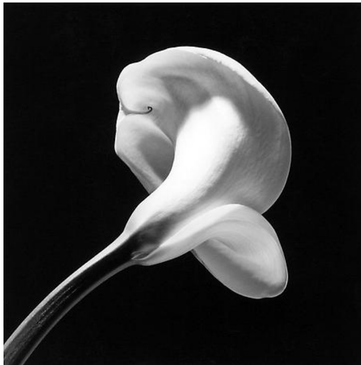
Calla Lily, 1984

sexualidade através das imagens é também uma conexão com o vetado. Mapplethorpe explicita “a natureza erótica dos corpos e poses sedutoras usadas para retratar santos e figuras sagradas.” A partir daí as noções de culpa e de pecado aparecem como instrumentos de uma dolorida submissão moral. Não se pode negar a quem quiser o direito à expressão. O limite do imaginado é o impossível. Não se pede uma aderência ou a imersão ao que se expõe, mas vetar, proibir, censurar, em nome de uma moral que admite o extermínio, que propõe o capitalismo sem limites é pura hipocrisia.