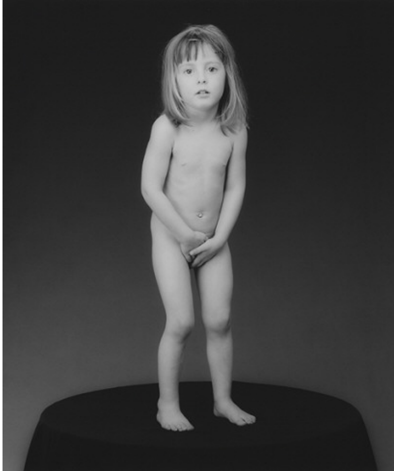
Eva Amurri, 1988. Gelatin silver print, edition 1/10, 58.6x49 cm.

Para Mapplethorpe, o corpo é um objeto a ser explorado e manipulado como forma e não apenas como presença simbólica. De uma tomada psicanalítica a ostentação fálica denota uma afirmação de poder, a intromissão e a exostulação da homossexualidade aparece aliada à dor e à agressividade, numa certa acidez postural. A exploração da dor como forma de prazer é também um desejo de dar a si um desvio, impondo necessariamente um culto à abjeção como uma filiação maldita e negativa da moralidade frívola.