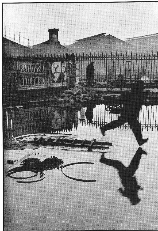
Detrás da Estação de Saint-Lazare, Paris, 1932