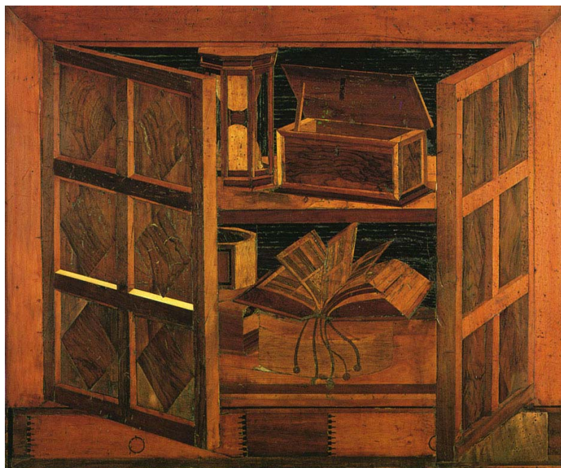
Figura 3: Antonio e Paolo Mola (atribuição), Armário com objetos (relógio de água, um pequeno cofre, um breviário, uma caixa) sacristia da Basilica de São Marcos em Veneza, final do século XV.

Rossi, quando jovem, tinha na realidade acreditado em um caminho diferente. Este está em grande parte representado em seu primeiro livro, A arquitetura da cidade , onde, mesmo que de uma maneira rica e ambígua, a arquitetura é entendida como uma realidade positiva e natural e como uma herança humana. E era uma realidade passível de ser conhecida com o rigor que a ciência costuma proceder. Não se deveria, portanto, partir das condições do ofício, nem de um debate interno a este, mas daquele mundo nobre e petrificado que é a arquitetura e que desde sempre vive fora de nós, indiferente ao desenvolvimento das ações humanas. Deste modo, ao método e maiêutica de Rogers, Rossi contrapunha a ambição de se estabelecer um sistema na escola: um sistema ordenado de conhecimentos que se tornasse também um sistema de enunciados e de princípios. Como se a arquitetura pudesse ser reconfigurada como um castelo vasto e ordenado. E como se do castelo interessassem menos suas imagens que suas estrutura e lei. Estrutura e lei das quais a escola