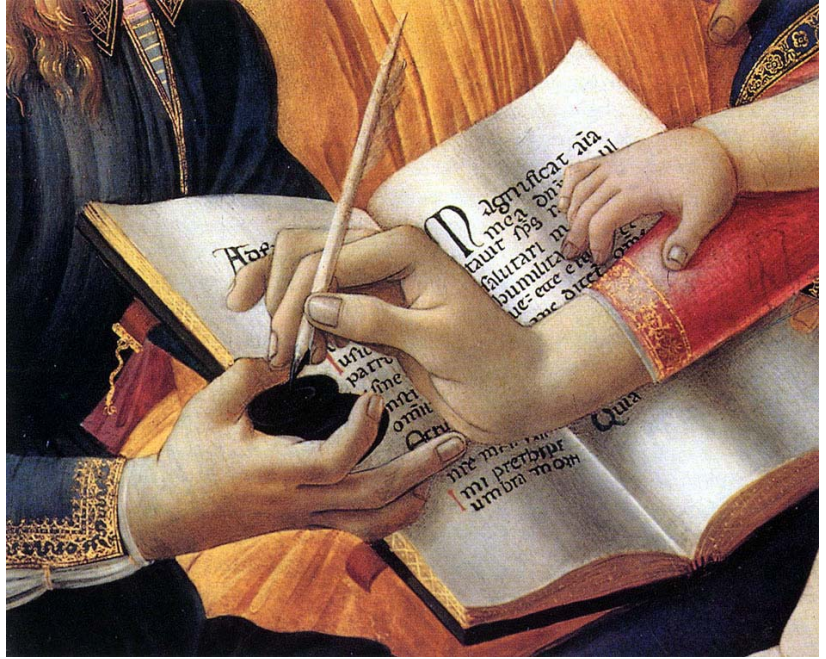
Figura 2: Sandro Botticelli, Nossa Senhora com o menino e cinco anjos (Madonna del Magnificat) , 1408-1480, detalhe; Florença, Galleria degli Uffizi.

«cidadela mental», de formas e figuras, que cada um possui, que se altera e enriquece com o tempo e que cada vez entra em ressonância com as ocasiões e com os temas que somos chamados a enfrentar? Não é verdade que a bagagem de imagens e de experiências de que o estudante dispõe quando entra na escola, se modifica e se reconstrói na relação estabelecida com aqueles que assume como mestres?