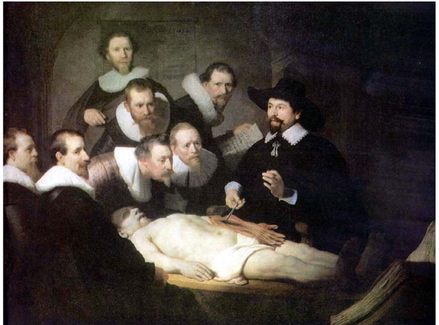
Figura 1: Rembrandt van Rijn, A lição de anatomia do doutor Tulp , 1632, Haia, Mauritshuis.

as questões da arquitetura de maneira direta, mas ampliando o olhar e colocando problemas. Rogers não se limitava ao que devia ensinar, mas abria um amplo arco de interesses, tanto que por meio de seu ensino os estudantes descobriam a filosofia, a literatura, a arte, o cinema, o teatro. E tornava-se uma experiência decisiva para eles.