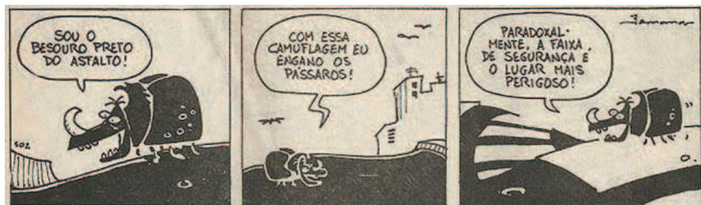
Figura 3: Tira da revista Níquel Náusea que pode servir para ilustrar conceitos evolutivos. In: GONSALES, F. Níquel Náusea . 2ª fase, n. 6, p. 27, tira 2. São Paulo: Palhaço, 1989.

As tiras da revista Níquel Náusea classificadas como tendo um possível uso ilustrativo em sala de aula são aquelas que demonstram a ação de forças (Deriva Genética, Seleção Natural, Migração) e processos evolutivos (Adaptação), bem como suas consequências. Alguns autores, por exemplo, indicam o uso de determinadas graphic novels no ensino de ciências para ajudar no entendimento de temas diversos, desde a teoria evolutiva darwiniana até aspectos sociais e científicos sobre bombas atômicas 33 . Do mesmo modo, tem sido defendido que a empatia provocada pelas HQs contribui para que elas sejam uma excelente ferramenta de auxílio ao aprendizado de temas científicos, especialmente com crianças 34 . A Figura 3 traz um exemplo de tira da revista Níquel Náusea que pode ter um uso ilustrativo no ensino da teoria evolutiva.