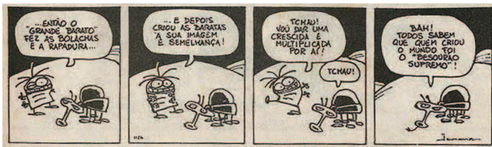
Figura 4: Tira que pode servir a um uso crítico em sala de aula. In: GONSALES, F. Níquel Náusea . 2ª fase, n. 22, p. 5, tira 5. São Paulo: Vhd Difusion, 1994.

O uso crítico das tiras da Níquel Náusea pode se dar na promoção de reflexões sobre as interpretações que são dadas à teoria evolutiva ou para introduzir temas controversos em sala de aula. Interpretações equivocadas estão muito presentes nos diversos discursos religiosos 37 e temas controversos são frequentes na mídia 38 . Assim, o tom crítico e satírico das tiras pode ajudar a mediar debates sobre temas polêmicos, como origem das espécies, engenharia genética, antropocentrismo e criacionismo. Munido da empatia que as HQs têm junto ao público infanto-juvenil, o professor pode abordar temas que são, geralmente, difíceis, e dialogar com as diversas culturas e visões de mundo presentes no ambiente escolar de forma mais sutil. Acredita-se, portanto, que as tiras da revista Níquel Náusea podem servir à crítica de preconceitos e visões de mundo, principalmente àquelas ligadas ao fundamentalismo religioso, que tanto permeiam assuntos controversos como a teoria evolutiva. A Figura 4 demonstra um exemplo de tira que pode ser usada para a abordagem crítica de termos relacionados a implicações da teoria evolutiva na sala de aula.