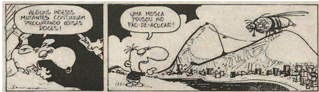
Figura 5: Tira da revista Níquel Náusea que pode servir a um uso metalinguístico no ensino da teoria evolutiva. In: GONSALES, F. Níquel Náusea . 2ª fase, n. 2, p. 29, tira 3. São Paulo: Circo, 1988.

Um trabalho realizado com crianças da sétima série de uma escola do estado do Rio de Janeiro indicou que para estas crianças o termo “mutação” é confundido com o termo “mutante”, de forma que elas representam aquele conceito fazendo desenhos de seres humanos com características absurdas e poderosas, claramente influenciadas por HQs como X-Men 39 . A metalinguagem sarcástica e corrosiva das tiras de Níquel Náusea , especialmente com relação à linguagem simplificadora e distorcida com que os quadrinhos apresentam a ciência e os seus conceitos, pode ser uma ótima ferramenta de trabalho com problemas como aqueles identificados para os alunos mencionados. Na Figura 5, tem-se um exemplo de tira que pode ser usada para levantar a discussão da forma como as mídias de massa apresentam a mutação.