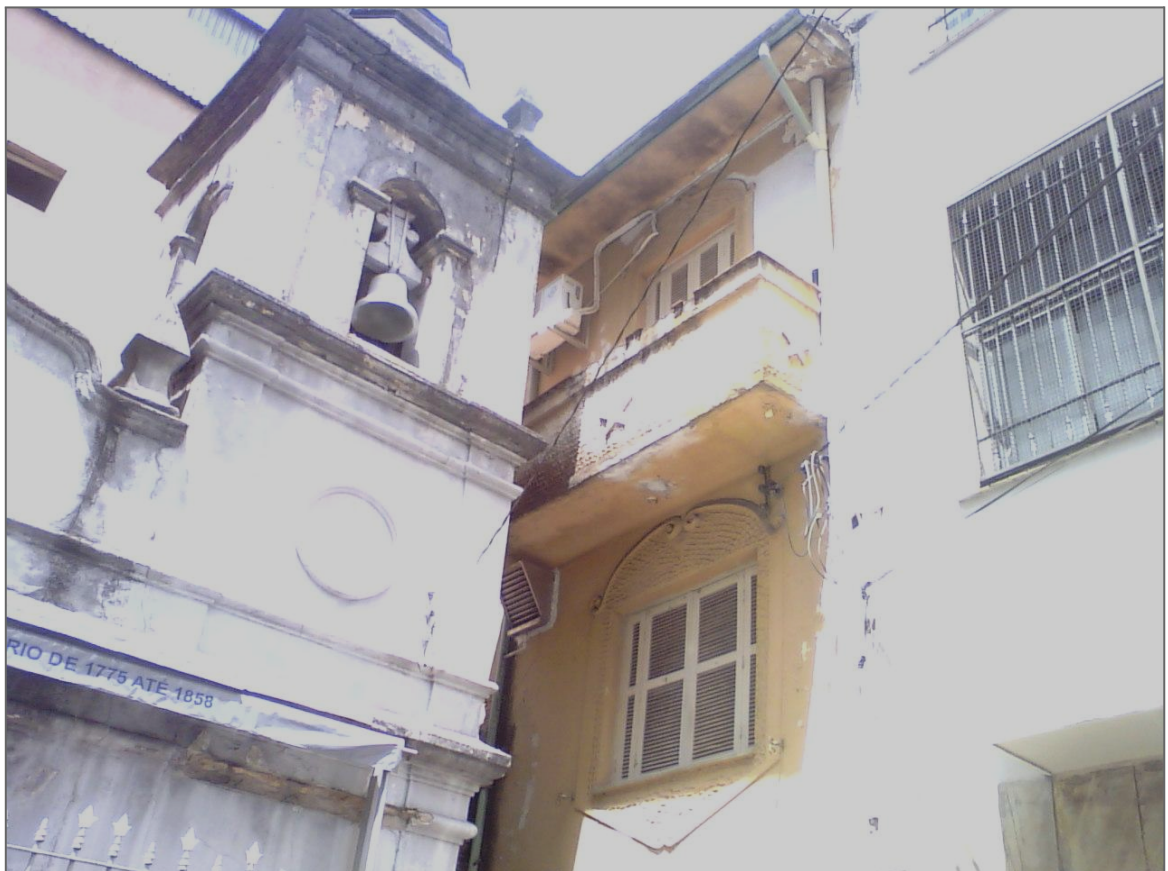
Fotografia de Dislane Zerbinatti Moraes, 2014.