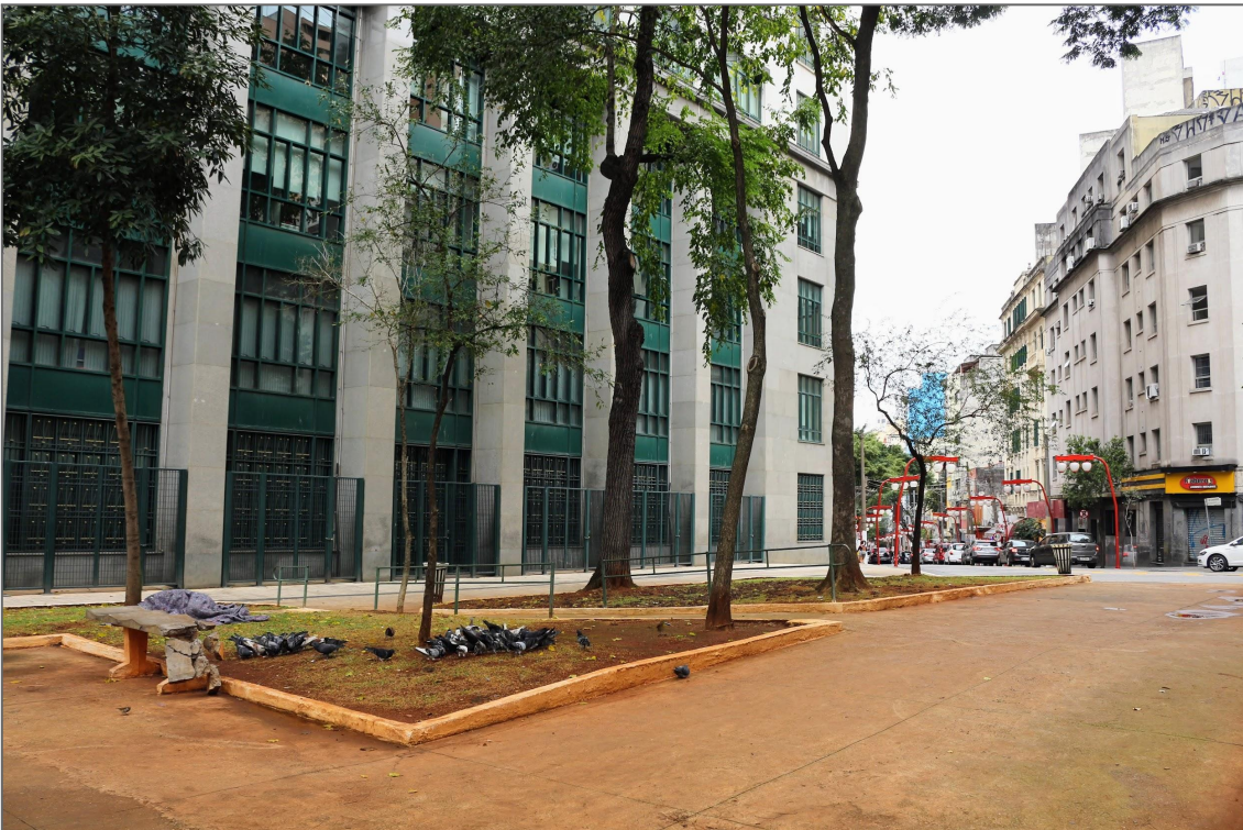
Fotografias de Fabíola Alice dos Anjos Durães, 2022.