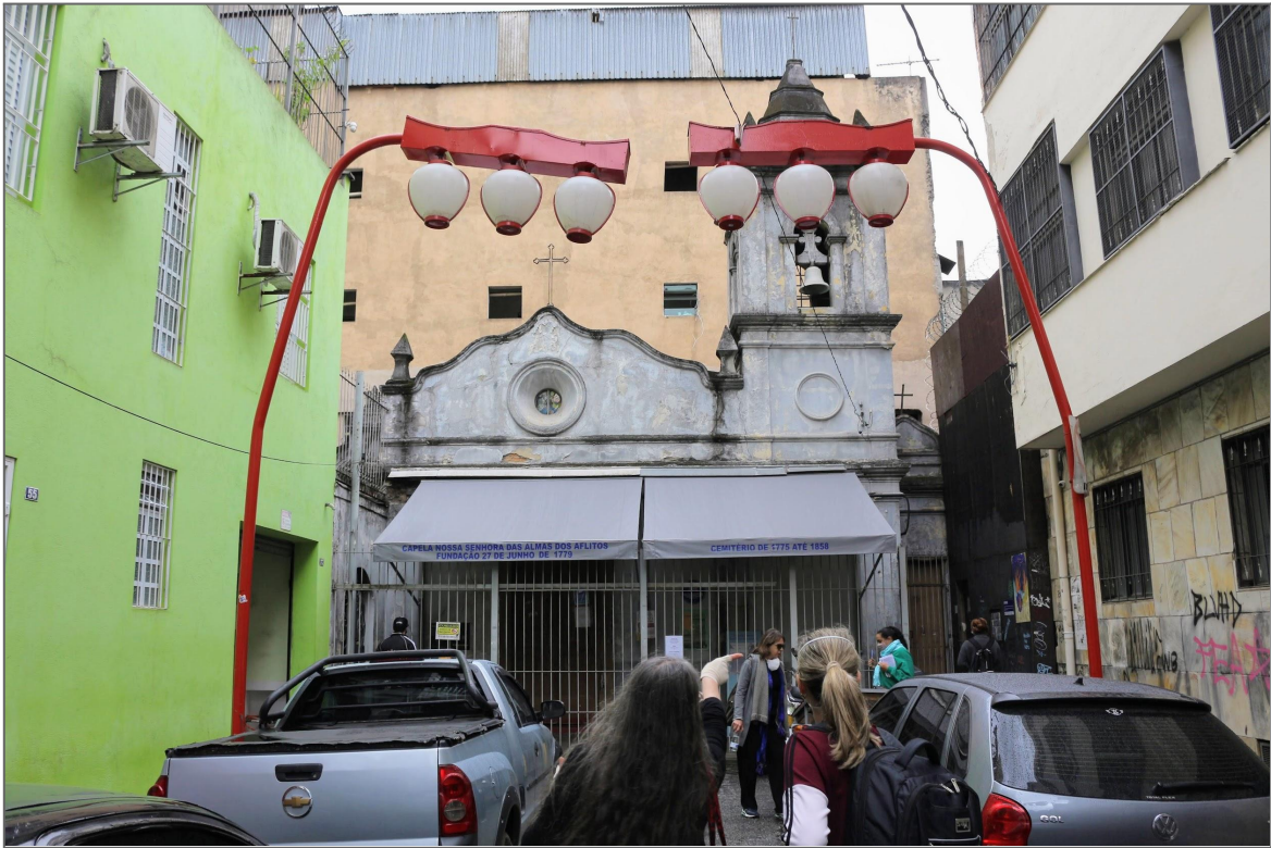
Fotografia de Fabíola Alice dos Anjos Durães, 2022.