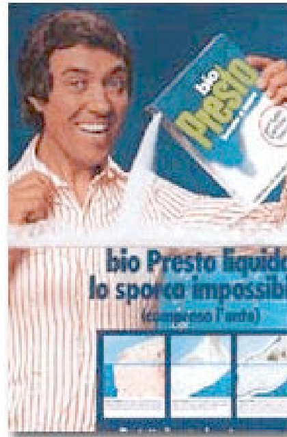
Pubblicità Bio Presto "L'uomo in ammollo"

Parallelamente, il clima di libertà sociale e culturale che si andava diffondendo nel paese, rese possibili anche creazioni originali, come gli annunci elaborati da Emanuele Pirella per i Jesus Jeans, nei quali venivano rappresentati: nel primo l'addome nudo di una ragazza con i jeans sbottonati in cui l'head line recitava " Non avrai altro Jeans all'infuori di me" e nell'altro il sedere di una ragazza in short, sempre di jeans, con l'head line che diceva "Chi mi ama mi segua".