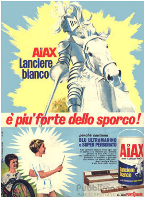
Pubblicità AiAX del 1968