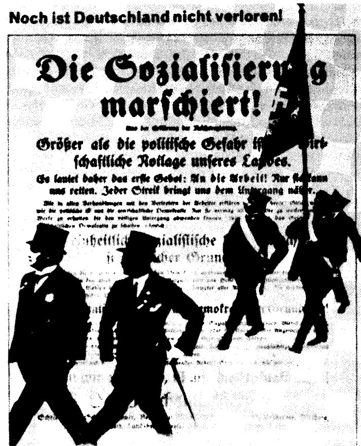
John Heartfield, A Alemanha não perdeu ainda! , 1932. (C)Gertrud Heartfield.

esófago. Inscriptio : «Adolfo, o super-homem»; subscriptio : «Engole ouro e cospe lata» (jogo de palavras: blech , em alemão, tanto pode significar lata como disparate). Outro exemplo: sobre um cartaz do SPD (Partido Social-Democrata Alemão), com o slogan «A socialização avança!», sobrepõem-se duas personagens do mundo da finança, altivos, de guarda-chuva e chapéu alto, e em segundo plano dois militares, um dos quais leva uma ban-