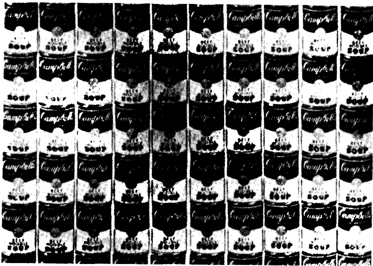
Neo-vanguarda: Andy Warhol, 100 Campbell's Soup Cans, 1962.

É neste ponto que Adorno aplica a categoria da nova crítica, inclinando-se a considerar que a singular ruptura histórica com a tradição, que caracterizou os movimentos históricos de vanguarda, deve entender-se como sendo o princípio do desenvolvimento da arte moderna em geral: «A activação da mudança dos programas e tendências estéticas, que os filisteus desprezaram como um abuso da moda, vê-se afectada por uma hostilidade sempre crescente, já detectada por Valéry» (13) . É claro que Adorno se dá conta de que a novidade é a etiqueta sob a qual o mercado oferece sempre aos consumidores as mesmas mercadorias. A sua argumentação torna-se discutível quando proclama que a arte se «apropria» do mercado dos bens de consumo. «Só conduzindo a sua imagerie (refere-se à poesia de Baudelaire) em direcção à autonomia própria, pode atravessar esse mercado que lhe é heterónimo. O moderno é arte mediante a imitação do estranho» ( AT , pág. 39). Começa aqui a cobrar vingança o facto de que Adorno não procure fixar com precisão o carácter histórico da categoria do