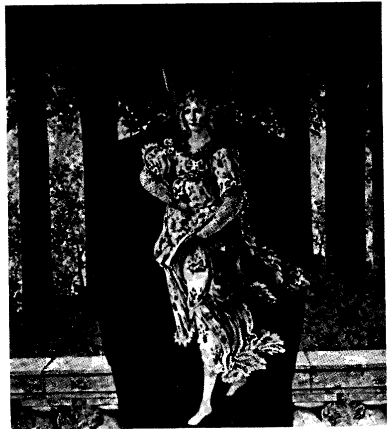
René Magritte, Le Ready-Made Bouquet , 1956. (C)ADAGP, Paris, 1982.

a arte que serve a vanguarda pode fazer justiça ao movimento histórico de desenvolvimento das técnicas artísticas. Cabe perguntar seriamente se a ruptura com a tradição, levada a cabo pelos movimentos históricos de vanguarda, não terá tornado supérfluo o discurso que relaciona o tempo presente com o momento histórico das técnicas artísticas. A sedução manifestada pelos movimentos de vanguarda em relação aos processos artísticos de épocas passadas (pense-se, por exemplo, na técnica dos mestres antigos em muitas obras de Magritte) torna quase impossí-