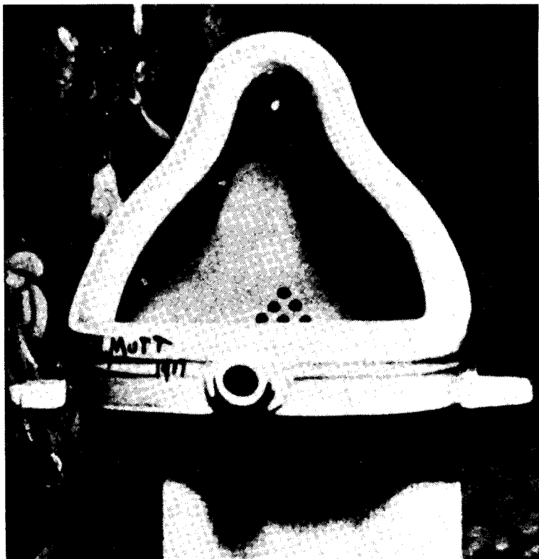
Marcel Duchamp, Fontaine par R. Mutt , 1917. (C)ADAGP, Paris, 1982.

mente no contraste entre os objectos produzidos em série, por um lado, e a assinatura e as exposições de arte, pelo outro. É evidente que uma provocação assim não pode ser repetida em qualquer momento. A provocação depende da natureza do seu objectivo: neste caso da ideia de que a arte é criada por indivíduos. Porém, uma vez que o urinol assinado é aceite nos museus, a provocação deixa de ter sentido e transforma-se no seu contrário. Quando um artista dos dias de hoje assina e exhibe uma chaminé de fogão, já não está a denunciar o mercado da arte: está a submeter-se a ele; não destrói, mas antes confirma, o conceito da cria-