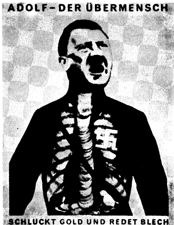
John Heartfield, Adolfo-O Superhomem-Que Engole Ouro... , 1932.

esófago. Inscriptio : «Adolfo, o super-homem»; subscriptio : «Engole ouro e cospe lata» (jogo de palavras: blech , em alemão, tanto pode significar lata como disparate). Outro exemplo: sobre um cartaz do SPD (Partido Social-Democrata Alemão), com o slogan «A socialização avança!», sobrepõem-se duas personagens do mundo da finança, altivos, de guarda-chuva e chapéu alto, e em segundo plano dois militares, um dos quais leva uma ban-