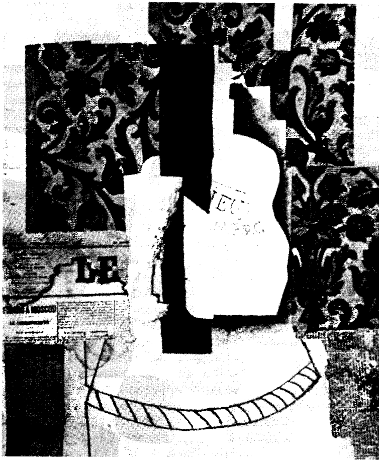
Pablo Picasso, Natureza morta , 1912.

vanguarda. A tentativa aponta para a criação de objectos estéticos que prescindam dos critérios tradicionais.