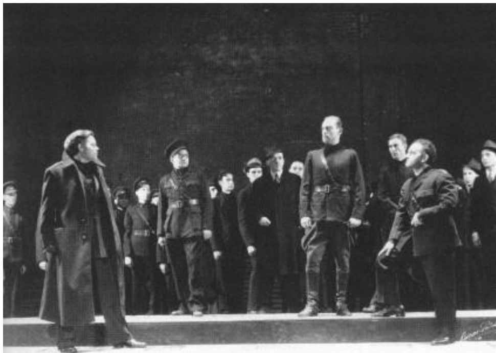
Caesar, 1937, direção de Orson Welles