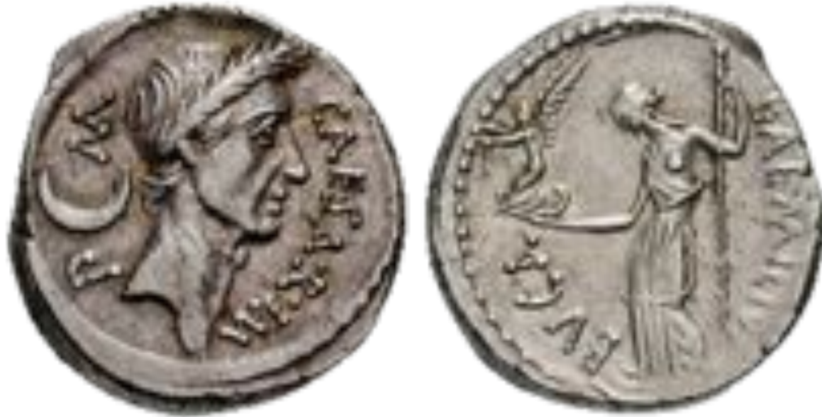
Denário com busto de Júlio César, 44 a.C.