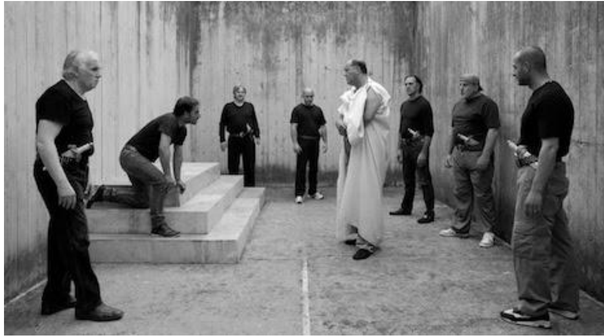
César deve morrer, 2013, Vittorio Taviani e Paolo Taviani