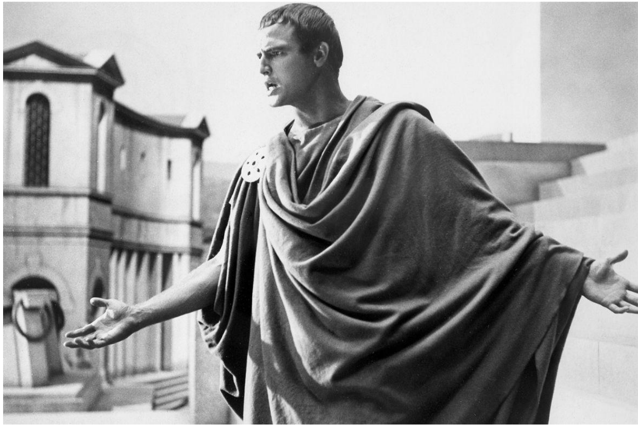
Júlio César, 1953, Joseph L. Mankiewicz