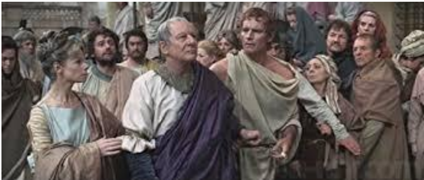
Júlio César, 1970, direção de Stuart Burge