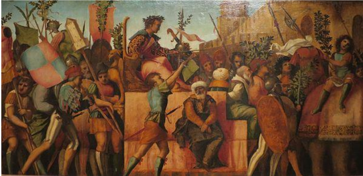
O triunfo de César, cerca de 1510, Jacopo Palma