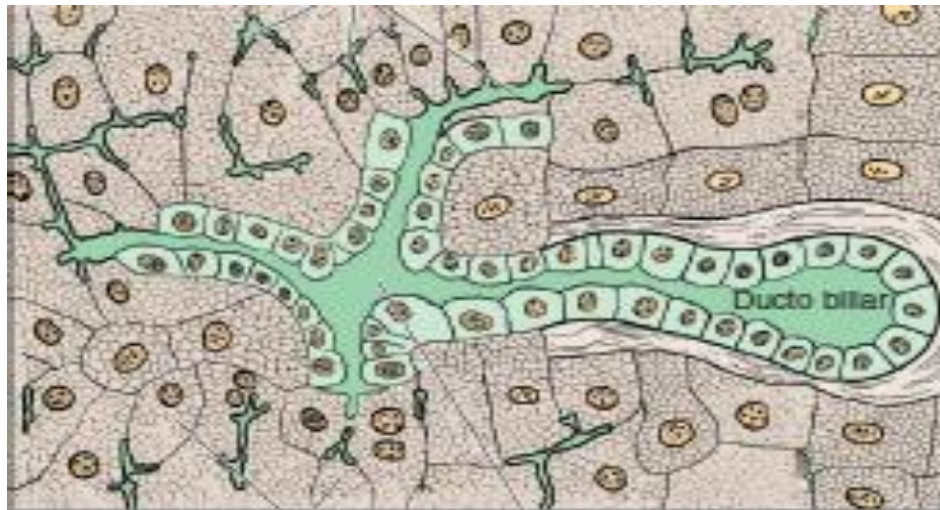
Figura 1 - Título da figura (fonte 10, sem negrito)

(fonte 10, sem negrito).