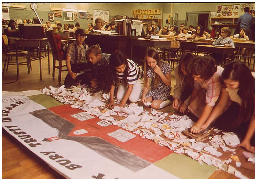
Figura 2.5 – Desenvolver projetos é uma forma de aprendizagem construtivista