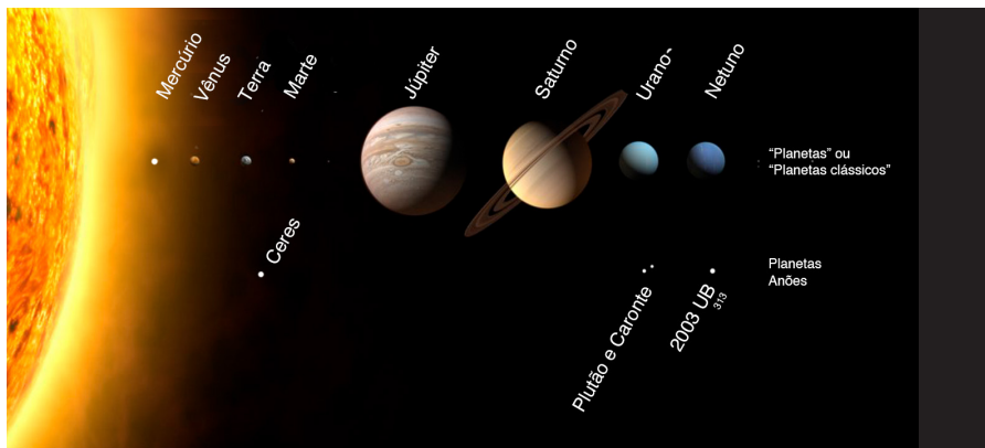
Figura 2.3.1 — O Sistema Solar: um fato objetivo?