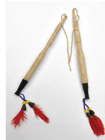
Brinco kayapó-gorotire.

Entre os Kayapó-Gorotire, por outro lado, o direito de uso de certos enfeites é condicionado pelo nome da pessoa. Essa divisão de privilégios e tarefas de acordo com o pertencimento a grupos sociais dentro de uma comunidade, entretanto, não corresponde ao que se entende comumente entre nós por especialização artesanal ou profissional, visto que todos os membros de todos os grupos têm o direito de produzir algum tipo de enfeite ou artefato.