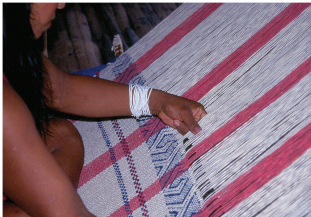
Tecelã kaxinawa (fotografia de Els Lagrou, 1995)

O líder de canto masculino é igualmente chamado de txana ibu , 'dono dos japins'. O japim, além de ser um pássaro tecelão, é também aquele que imita o maior número de cantos de outros pássaros e animais. Mulheres aprendem cantos que as ajudam a aprender a tecer com desenho, assim como a desenvolver outras atividades produtivas da vida em comunidade, enquanto homens aprendem cantos ligados a sua esfera específica de produtividade. A capacidade mimética musical, procurada e emulada pelos cantores da aldeia, que absorvem as qualidades desse pássaro no rito de consagração do novo líder de canto 7 , importa antes por causa do seu valor 'produtivo', do que 'representativo'. O canto masculino torna possível a caça: ao imitar o canto dos animais, o caçador os chama para perto de si, os seduz para poder capturá-los. O canto feminino torna presente ao ritual as entidades donas das substâncias utilizadas para 'refazer' o corpo da criança, indo do milho e da água utilizados para produzir a caiçuma às plantas medicinais e tintas utilizadas na sua decoração.