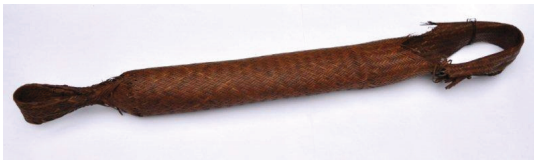
Tipiti wayana (fotografia de Els Lagrou). Acervo do Museu do Índio.

Na tradição pictórica ocidental, temos que a cópia tende a ser de natureza diversa do modelo. A pintura na tela é feita de materiais distintos daqueles que conformam o modelo e, na sua confecção, são utilizadas técnicas próprias à pintura, de maneira que as técnicas de produção de um quadro difiram das técnicas de produção, por exemplo, do corpo humano ou então do vaso com flores representados no quadro. Uma escultura de um torso humano também não visa a reconstituir o corpo, sua estrutura, nem seu modo de funcionar; somente pretende invocá-lo, representá-lo. No universo artefactual ameríndio, no entanto, a cópia é muitas vezes considerada como sendo da mesma natureza que o modelo, e tende a ser produzida através das mesmas técnicas que o original. Por essa razão, podemos afirmar que, entre os ameríndios, artefatos são como corpos e corpos são como artefatos. Na medida em que a etnologia começa a dar mais atenção ao mundo artefactual que acompanha a fabricação do corpo ameríndio, a própria noção de corpo pode ser redefinida.