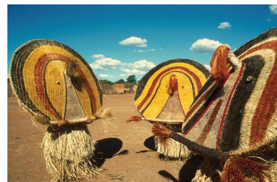
Máscaras wauja, apapaatai atujuwa.

Como os cantores araweté, os artistas wauja, autores de máscaras, painéis e, também, de desenhos em papel de grande apelo plástico (BARCELOS, 1999). localizam em sonhos sua inspiração para a representação dos apapaatai , seres sobrenaturais causadores de doenças e passíveis de serem apaziguados através da promoção de grandes festas e sua homenagem. Neste caso, são fabricadas suas 'roupas' encenadas na forma de máscaras de grandes proporções. Os desenhistas wauja são os xamãs ou pajés da aldeia, os que sabem sonhar com estes seres sobrenaturais. Deste modo, os xamãs tornam-se os maiores artistas desta sociedade, pois, ao sonharem com os apapaatai , seres invisíveis a olho nu, criam novas imagens destes seres que serão materializadas na forma de máscaras rituais. Esses mesmos seres são visualizados pelo pajé em miniatura dentro do paciente, onde atuam como agentes patogênicos e precisam ser retirados como parte do processo de cura.