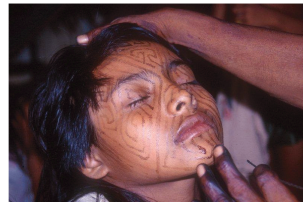
Menina sendo pintada com kene kuin , no estilo pua kene (desenho cruzado) com motivo nawan kene.