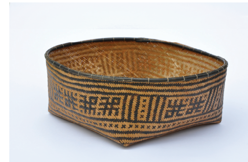
Cesto wayana com motivo palapi , "espécie de andorinha". Acervo do Museu do Índio. Fonte identificação peça, Van Velthem 1995: 248.

Entre os Wayana, o peso do 'modelo' tem sentido cosmológico. Inovar é perigoso, porque o modo certo de se produzirem corpos e artefatos foi estabelecido pelos demiurgos dos tempos de criação. O conservadorismo estilístico deste grupo de língua karib lembra o dos Wauja (autodenominação dos Waura, grupo arawak, Alto Xingu), produtores de máscaras rituais, no sentido de que ambos acreditam que a relação intrínseca entre o modelo e sua cópia torna a produção artesanal uma empreitada arriscada. No caso wauja o ser parcialmente reproduzido no artefato pode se vingar se a confecção for artisticamente mal feita, enquanto entre os Wayana existe o risco da tradução do ser em artefato ser tão completa que ele ganhe agência e vida próprias (VAN VELTHEM, 2003).