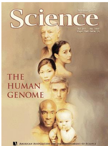
Figura 3. Capas dos periódicos Nature e Science, respectivamente de 15 e de 16 de fevereiro de 2001 2 .