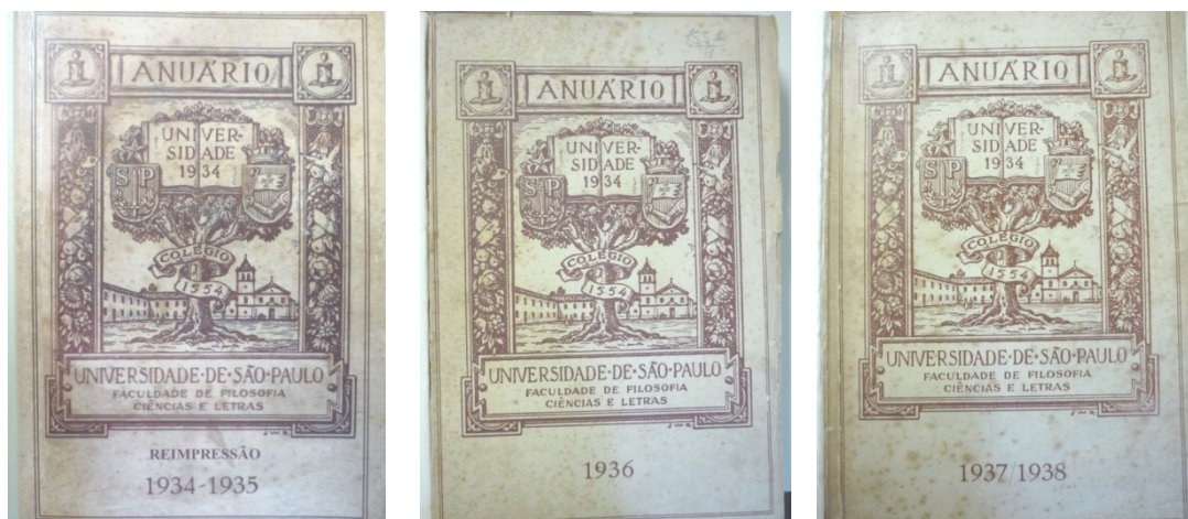
Figura 3: Capas dos anuários da FFCL-USP (1934-1935, 1936, 1937-1938)

Como se pode notar, alguns dos símbolos apresentados na imagem do Brasão de armas da USP se repetem nessa figura. Dessa vez, o livro, símbolo do conhecimento e também da USP, é o elemento que se encontra entre os símbolos do estado e da cidade de São Paulo. A USP parece emergir como continuidade do colégio jesuíta fundado em 1554. Fato significativo é o símbolo escolhido para dar unidade ao conjunto, uma árvore forte e frondosa cujas raízes parecem estar bem presas ao solo. A figura da árvore chama-nos a atenção por nos remeter à figura da “árvore genealógica” que, por sua vez, indica uma relação hierárquica de ascendência e subordinação. Nessa leitura, a USP representaria o ápice do conhecimento produzido por São Paulo.