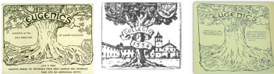
Figura 6: Comparação entre três logos.

Apresentadas lado a lado, as três imagens exibem certa semelhança, seja em relação aos símbolos de que lançam mão para sua composição, seja nos significados que inspiram.