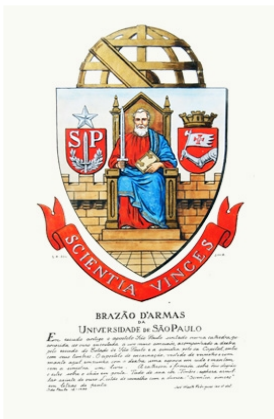
Figura 2: Brasão de armas da Universidade de São Paulo

O texto e a imagem do Brasão de armas exacerbam a relação entre a USP e São Paulo. Com essa imagem a universidade passaria à história como uma instituição que representava a vitória daqueles paulistas que, derrotados pelas armas, venciam pela ciência.