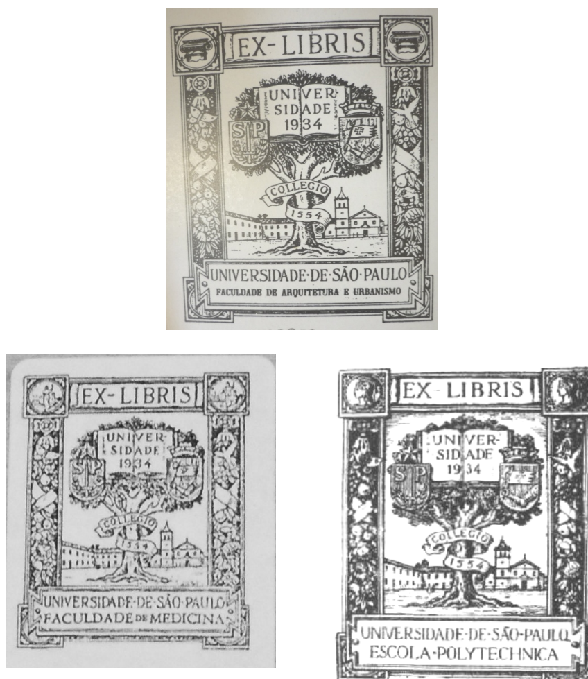
Figura 7: Ex libris usado pela USP

Voltando a figura 3 destacamos que ela também tem sido utilizada como ex libris 409 em algumas Faculdades da USP, como se pode verificar a seguir: