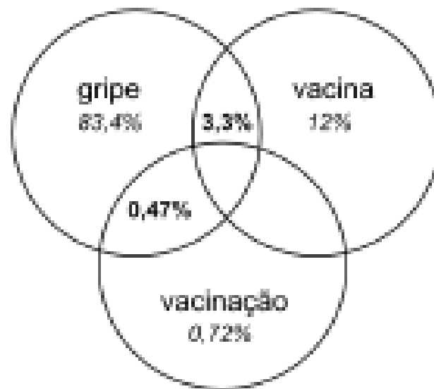
Fig. 2. The overall proportion of microblogs concerning the query words used in the retrieval process and their intersection.