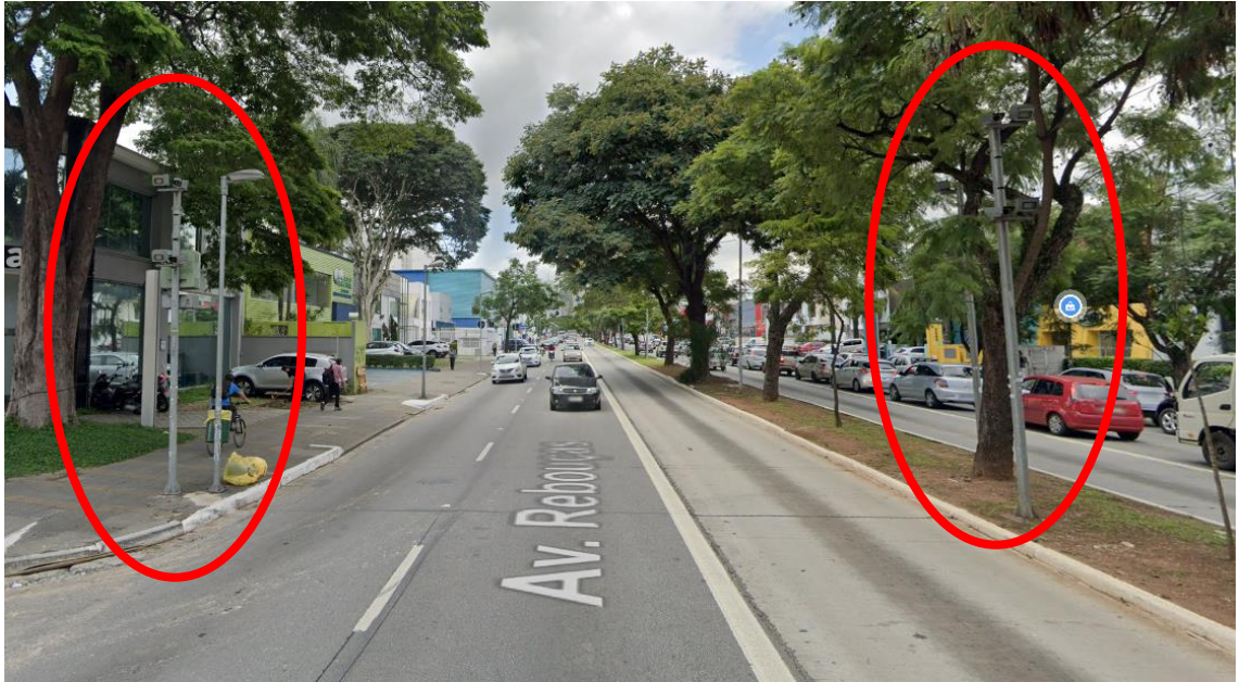
Imagem 2: Radares sentido Bairro (5204 e 5205)