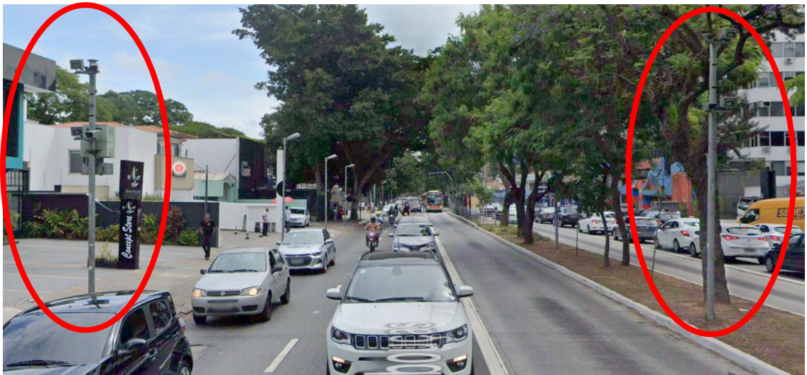
Imagem 3: Radares sentido Centro (5202 e 5203)