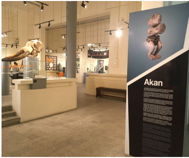
1- Le musée des Civilisations