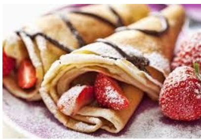
2 - Les crêpes