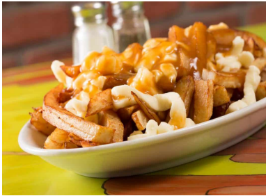
1- La Poutine