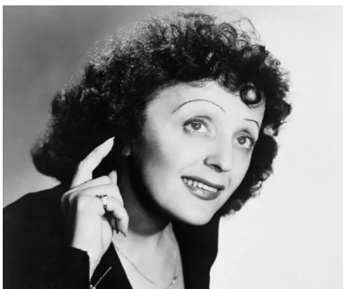
1- Édith Piaf