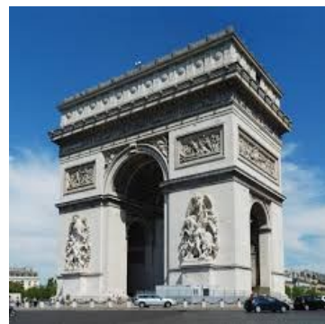
2- L'Arc du Triomphe