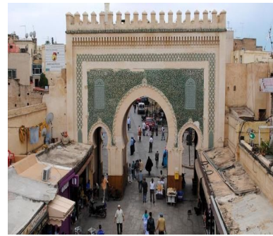
3- Médina de Fès

[ ] au Sénégal [ ] au Maroc [ ] en Côte d'Ivoire