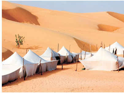
2- Le désert de Lompoul