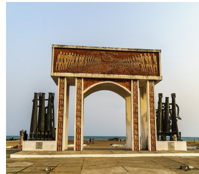
3- La Porte du non retour

[ ] en Belgique [ ] en France [ ] au Bénin