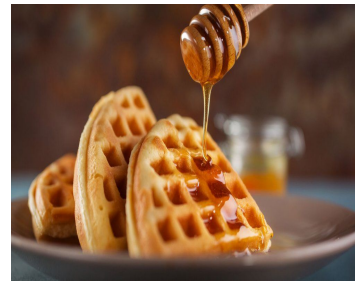
3- La gaufre