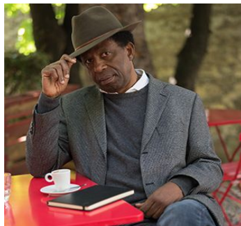
2- Dany Laferrière