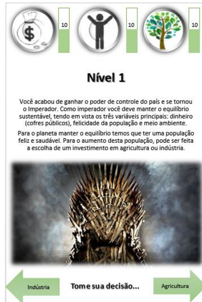
Figura 2 - Carta gamificada.