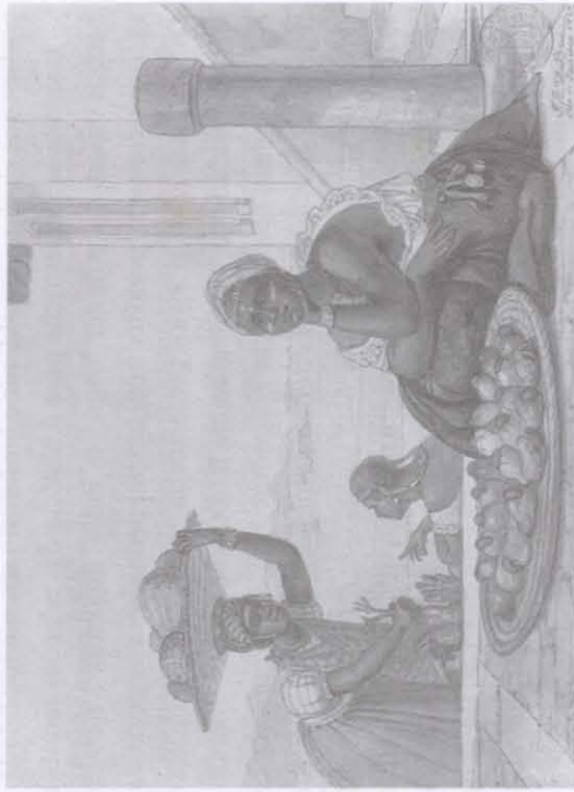
Jean-Baptiste Debret, Negra tatuada vendendo caju (1827)

Além da preocupação com a desomogeneização e com a apresentação de sujeitos ativos, alguns princípios do ensino do