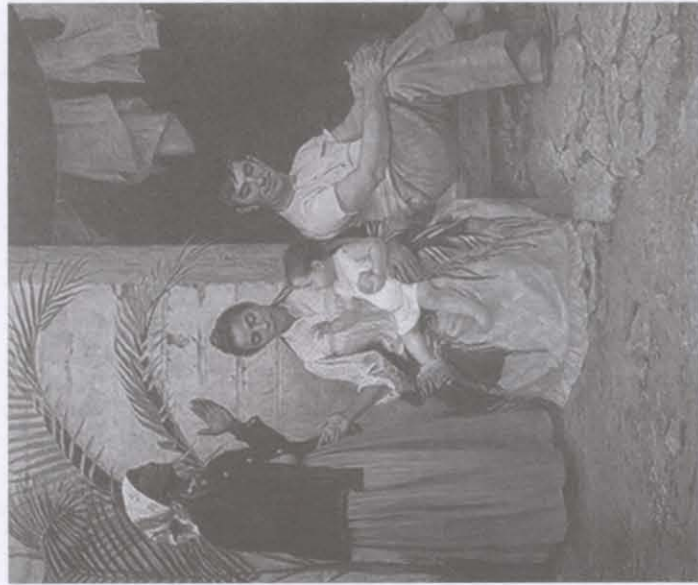
Brocos, Modesto. A redenção de Cam, 1895, óleo sobre tela, c.i.d. 199 cm x 166 cm. Museu Nacional de Belas Artes (Rio de Janeiro, RJ). 27

Para os alunos do Ensino Médio talvez seja interessante saber que este quadro já foi objeto de questão de vestibular da Fuvest, de 2006. A questão pedia que se relacionasse o quadro com as questões da imigração europeia do final do século XIX e com as “concepções dominantes sobre raças no período.” 28