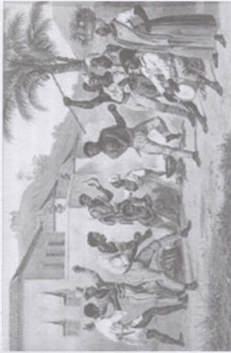
Moritz Rugendas, Jogar capoeira (1835)