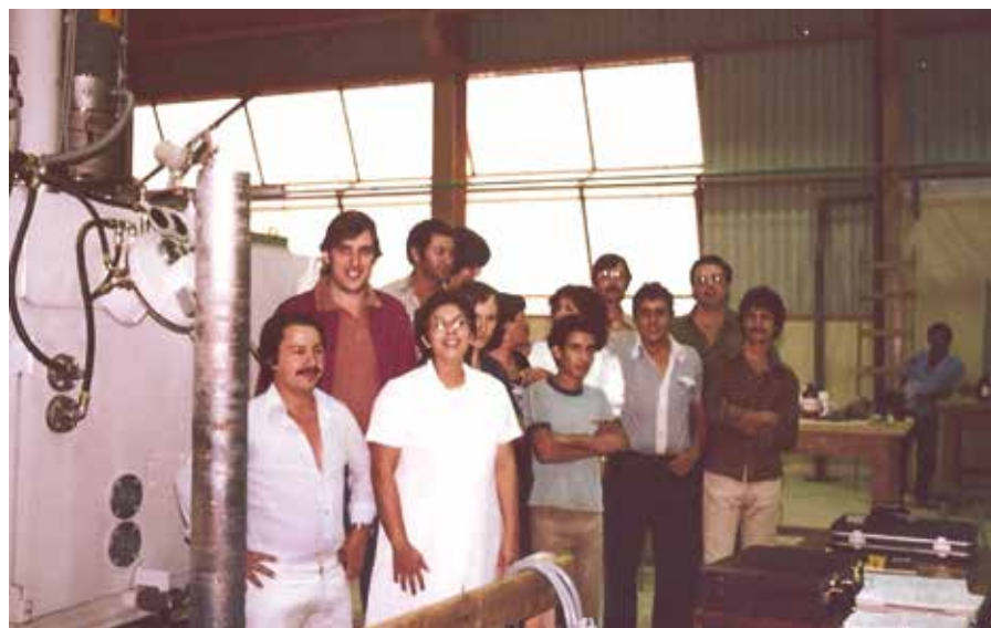
Figura 3 | Comissionamento do forno ES 2/18/300 CF em Lorena. Primeiro lingote produzido no Brasil, a partir de tecnologia brasileira (1981). Fonte: [2]

O novo conceito permitiu abandonar a purificação química do óxido do metal de interesse, fazer uma redução com alumínio (aluminotermia) de um óxido de grau técnico (química sumária) e obter um metal bruto, cujas impurezas