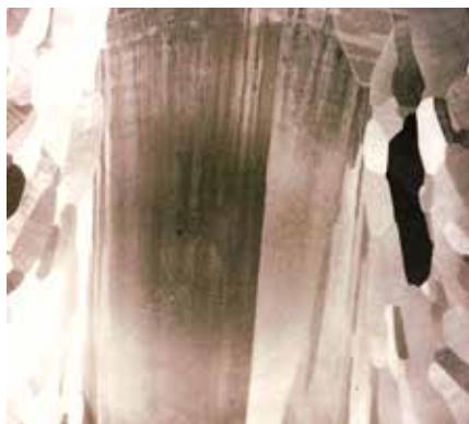
Figura 5 | Corte longitudinal do lingote, produzido pela nova rota, apresentando estrutura praticamente monocristalina no centro. Fonte: [2]