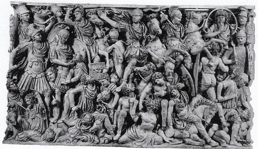
2 Scena di battaglia fra Romani e Germani su un sarcofago tardoromano.