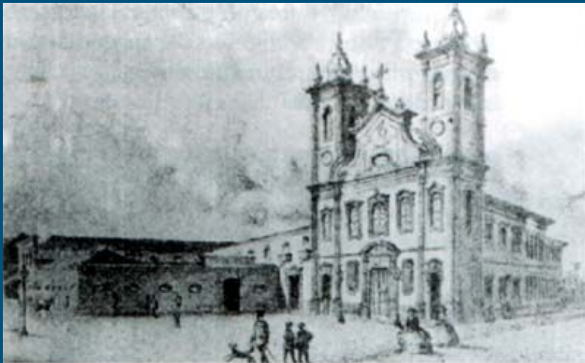
Colégio Pedro II, 1861, MG, Museu Mariano Procópio.