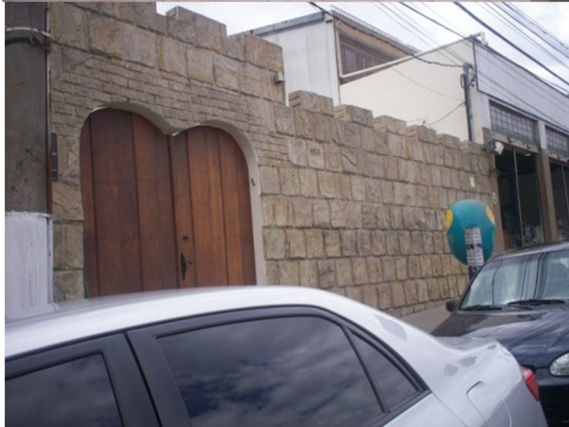
Mikve e porta principal da Sinagoga Har Tzion de Belo Horizonte