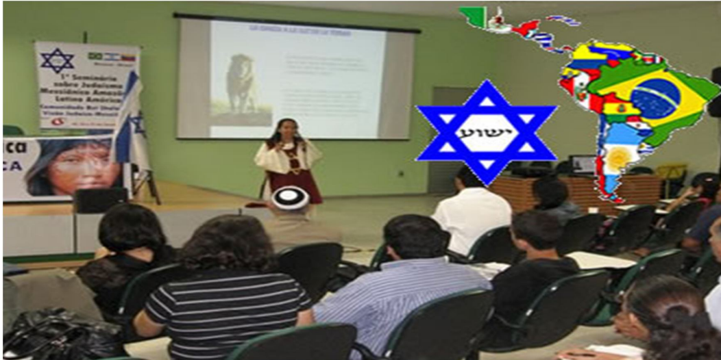
Serviço religioso na sinagoga Bet Shalom Amazônia em http://www.betshalomamazonia.com/.em03/07/2012