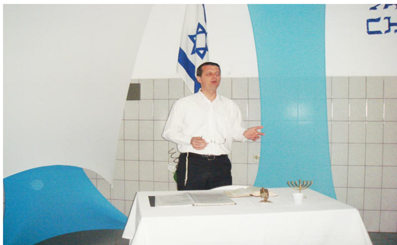
Festas de Purim e Chanucá na sinagoga messiânica Shemá Israel- Votorantim- SP