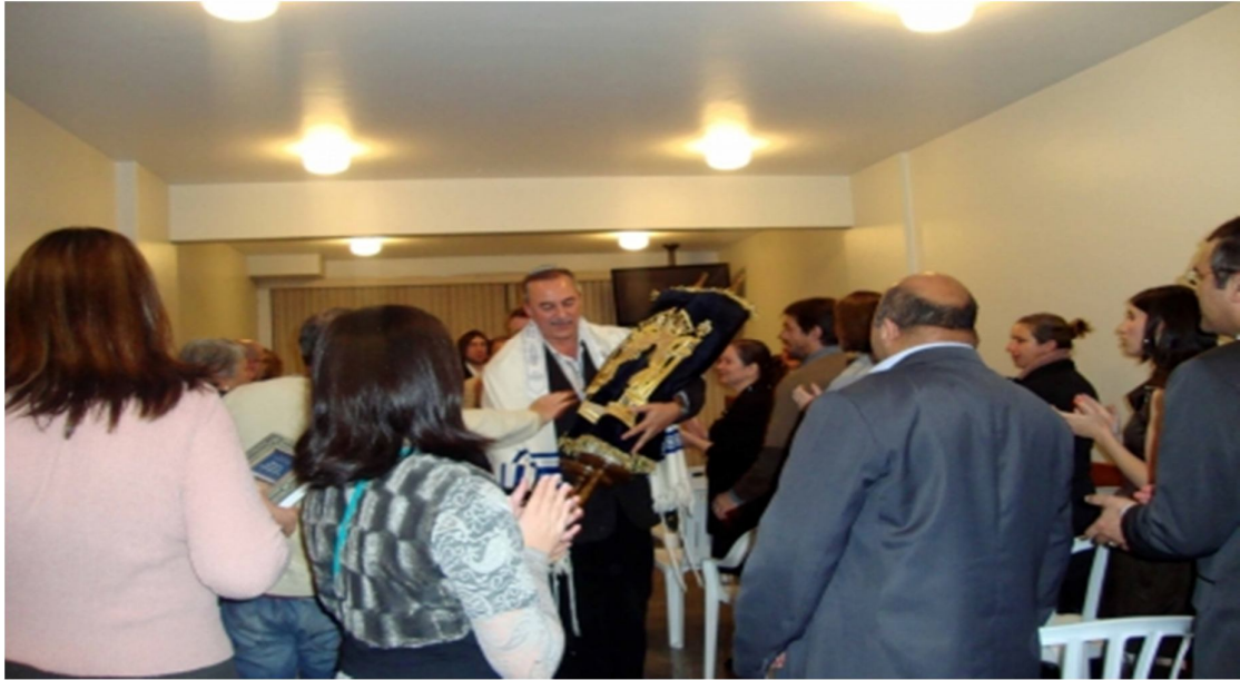
Serviço religioso da Sinagoga Messiânica Sar-El Curitiba- PR em http://sarel.org.br/index.php , acesso em 03/07/2012