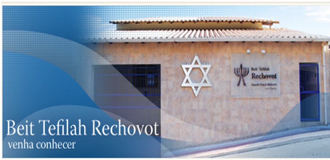
Fachada da sinagoga messiânica de Vitória-ES em http://www.rechovot.org.br/web/multimedia/fotos/ acesso em 03/07/2012

Na fotografia abaixo, podemos ver a fachada da sinagoga messiânica Rechovot, com a presença da Estrela de David e a Menorá estilizada em sua placa.