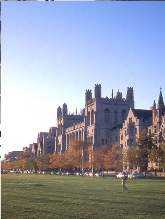
University of Chicago