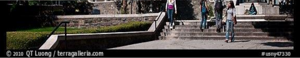
City University of New York