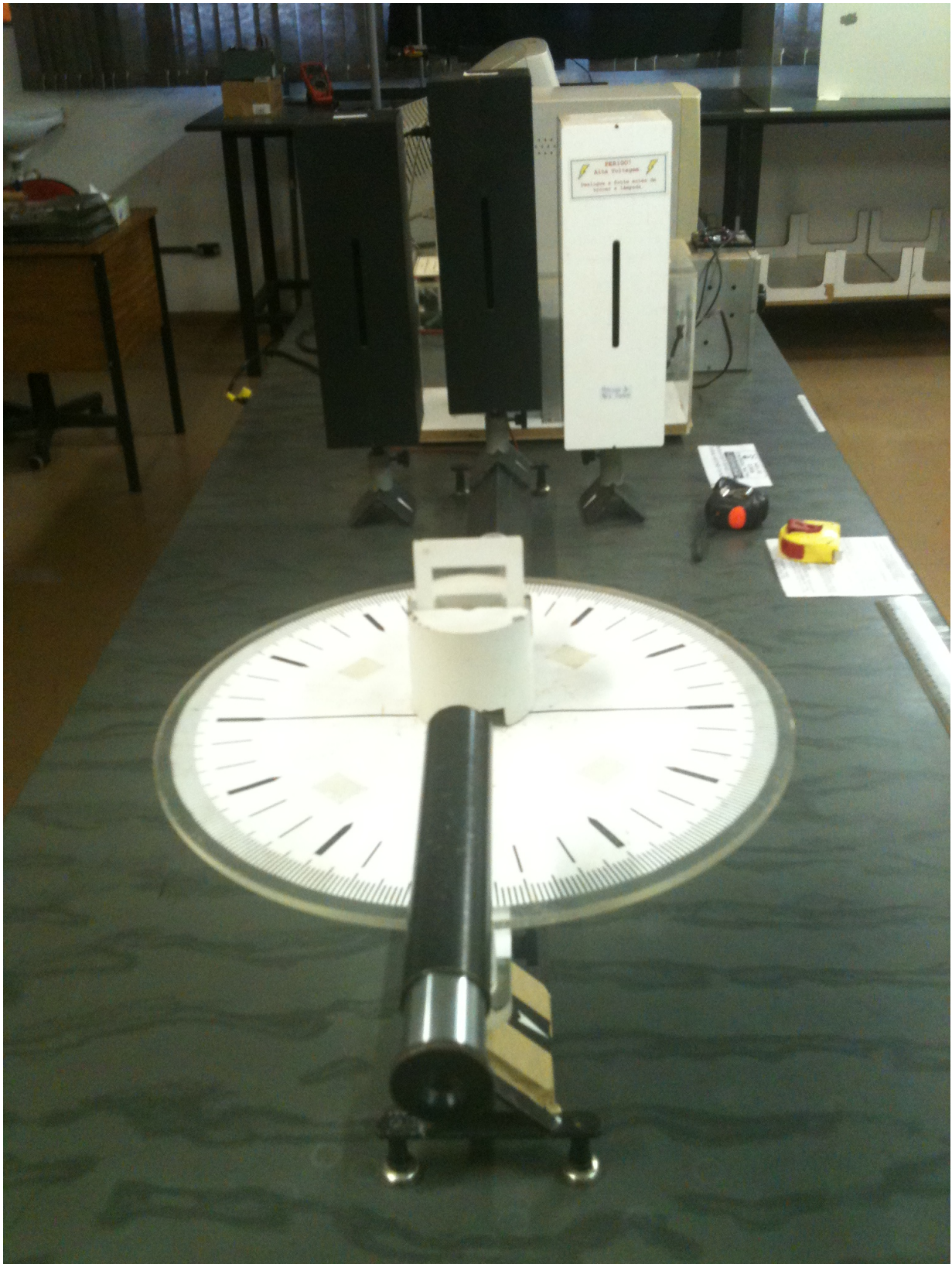
Figura 3.1: Fontes de plasma do experimento da série de Balmer posicionadas para observação pelo telescópio. A radiação da fenda de saída da fonte atravessa pela grade de difração, o ângulo de difração é mensurado pelo goniômetro posicionado na base do telescópio.