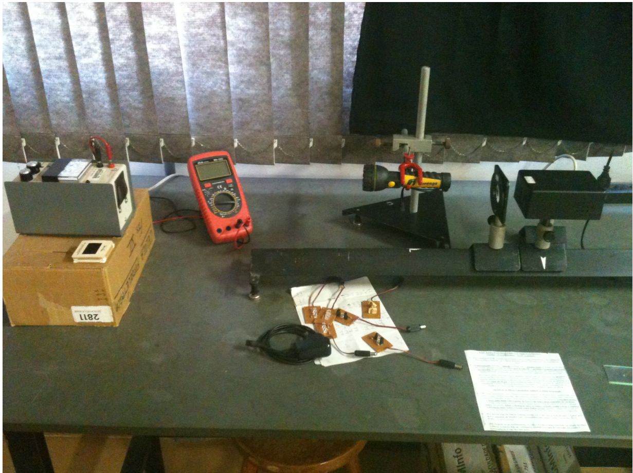
Figura 5.1: Montagem experimental para o efeito fotoelétrico. As fontes ao lado direito são o laser, LEDs, e uma fonte branca com filtros que podem ser posicionados na entrada do detector. Este detector absorve a radiação e gera uma corrente, a qual pode ser freada com um potencial retardador.