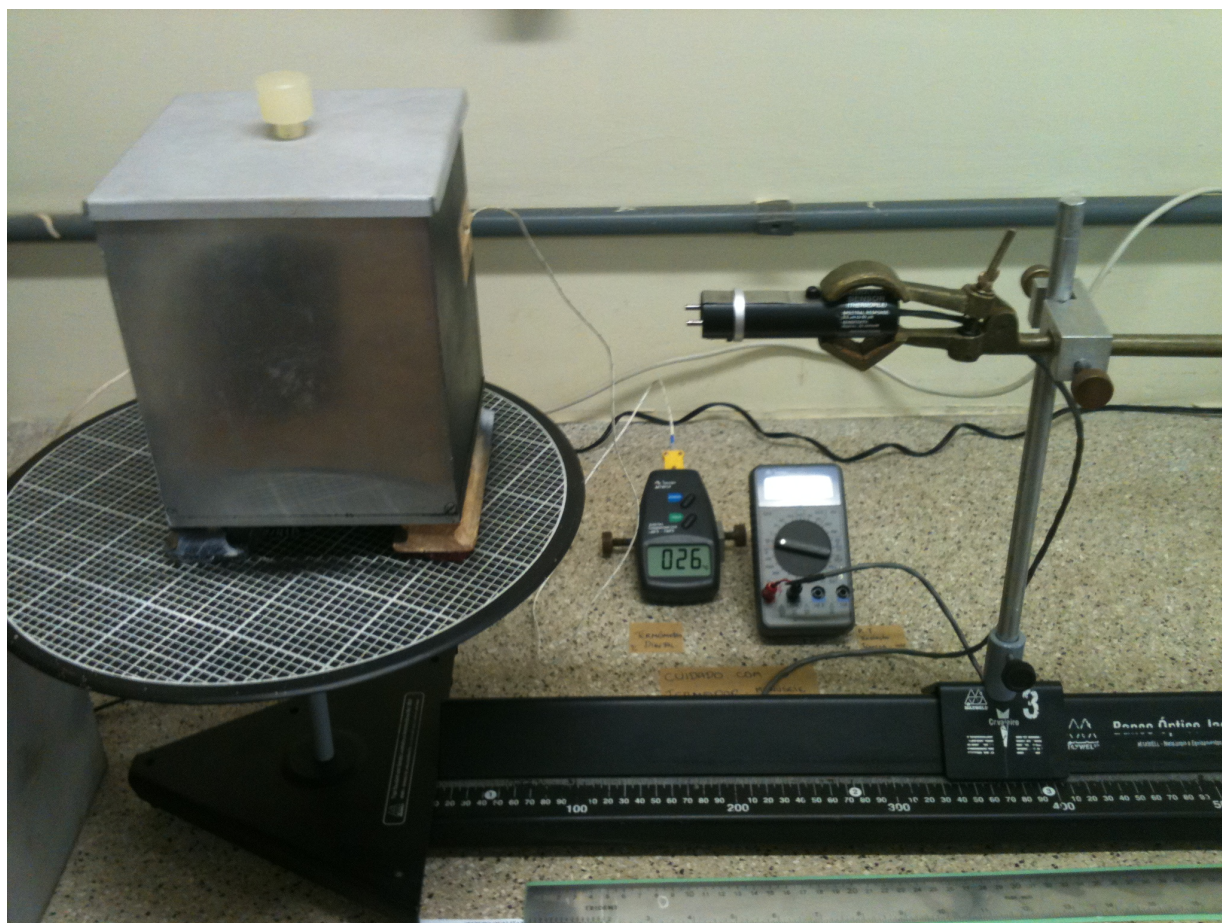
Figura 2.2: Cubo de radiação térmica, com um termômetro digital acoplado a uma das faces e o detector de radiação posicionado em frente a face preta.