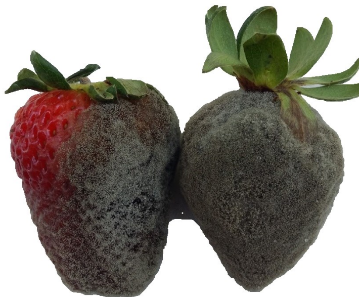
Mofa cinzento Botrytis cinerea