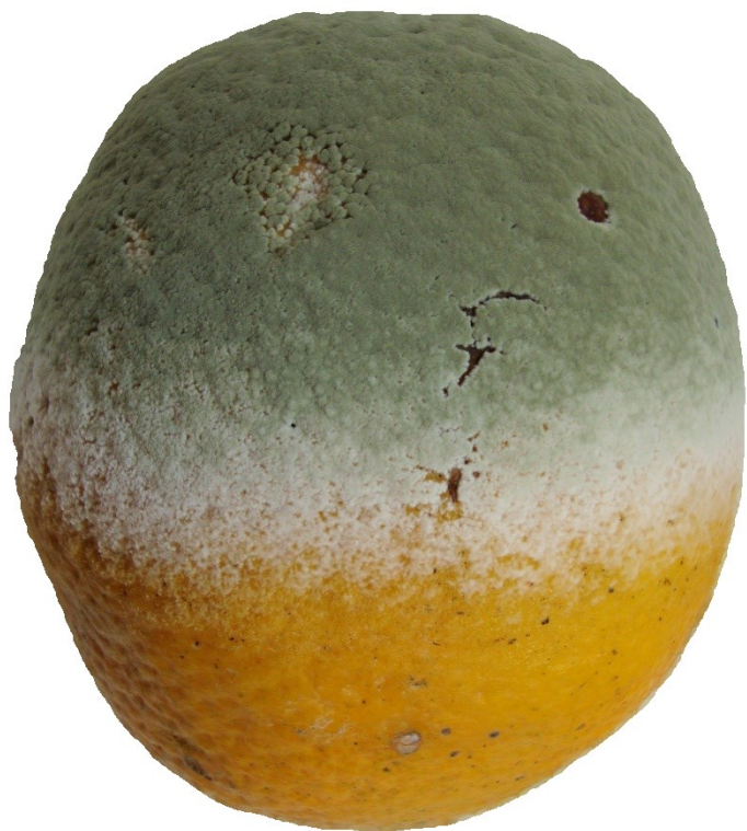
Bolor verde dos citros Penicillium digitatum