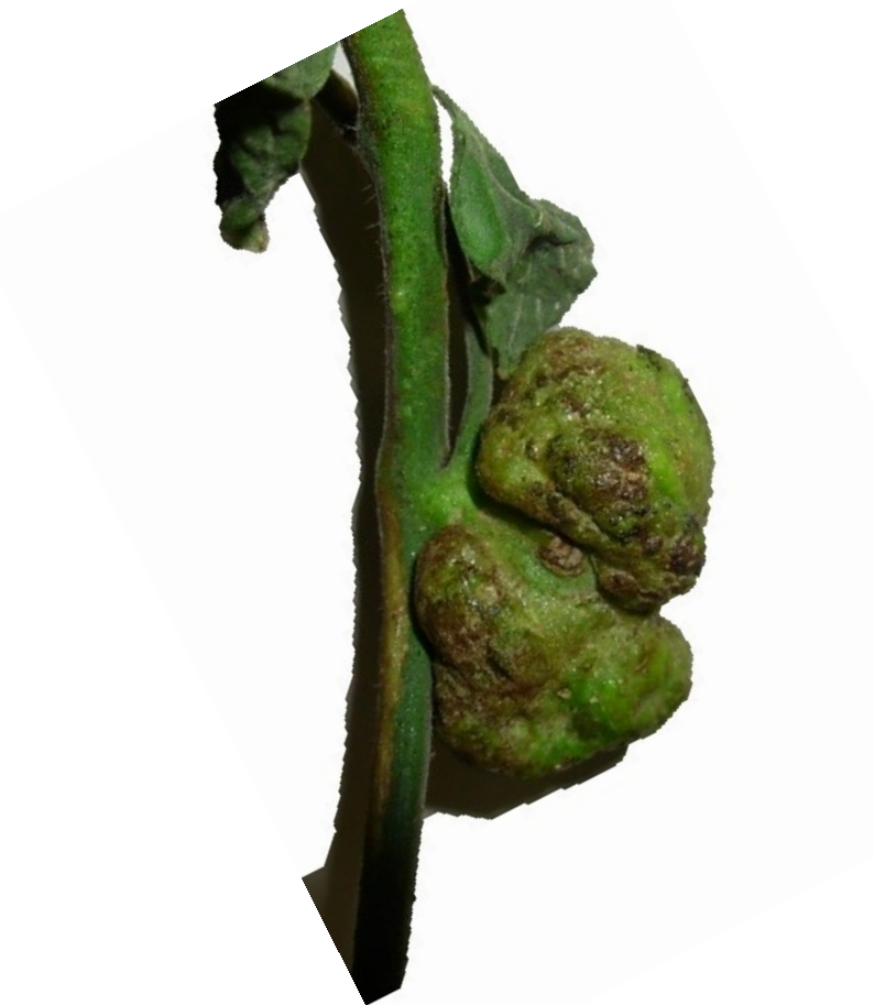
Galha em tomateiro Agrobacterium