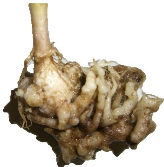
Hérnia das crucíferas Plasmodiophora brassicae