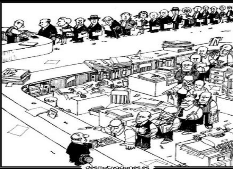
La administración burocrática