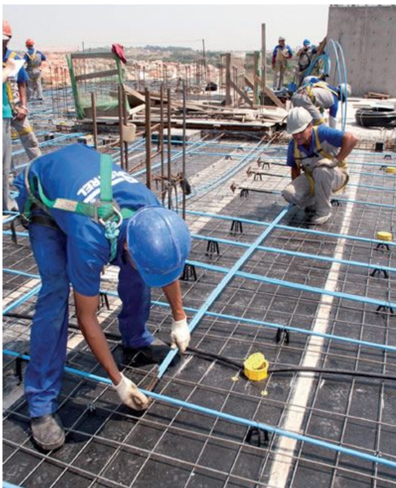
Solução para vencer grandes vãos, as lajes protendidas com cordoalhas engraxadas e plastificadas facilitam a execução, dispensando bainhas metálicas e injeção de nata de cimento

Em alguns casos, as lajes nervuradas podem significar uma alternativa quando se quer evitar a protensão. Apesar de possuir maior espessura, esse tipo de laje consome menos concreto por conta dos vazios entre as nervuras que podem ser aparentes ou preenchidos com materiais inertes, como tijolos cerâmicos e EPS, resultando em um conjunto mais leve. O consumo de aço também é menor, pois a espessura maior aumenta a eficiência das barras. Outro ponto a favor das lajes nervuradas é permitir que as vigas e capitéis possam ser embutidos na espessura da laje.