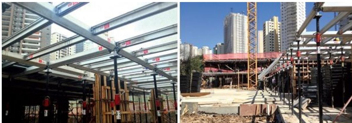
Sistema de escoramento de alumínio acelerou a produção no canteiro de obras e reduziu o consumo de madeira na obra