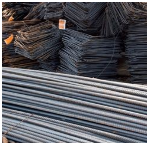
Ao dispensar as etapas e mão de obra necessárias ao corte e dobra do aço, a tecnologia do aço pronto permitiu à OR reduzir o tempo de preparação e montagem da armadura das lajes

A Odebrecht Realizações Imobiliárias (OR) apostou em duas soluções para agilizar a execução da estrutura do edifício Biografia Vila Mariana, em São Paulo, composta por lajes nervuradas com cubetas nos primeiros grandes andares, e lajes maciças nos pavimentos-tipo. Uma delas foi a opção pelo emprego do aço pronto - que chegava cortado, dobrado e etiquetado com as indicações do seu posicionamento nos pilares, vigas, armações de laje etc. - para aumentar a produtividade na montagem da armadura e reduzir o desperdício de material. "Também fizemos, juntamente com o calculista, uma reformulação na armação da laje para que pudéssemos substituir as barras retas intercaladas por telas de aço soldado com diâmetros diversos que atendessem às necessidades