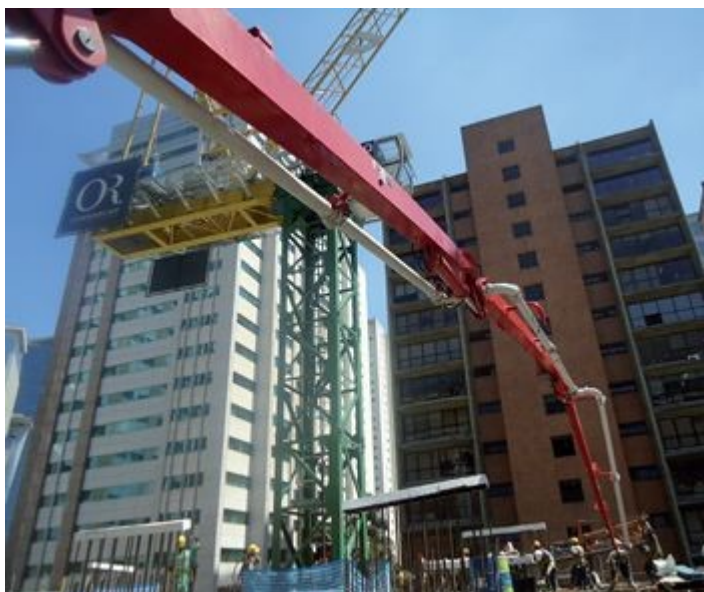
Planejamento integrado das atividades permite que atividades inovadoras convivam com soluções tradicionais sem que haja atrasos ou interferências