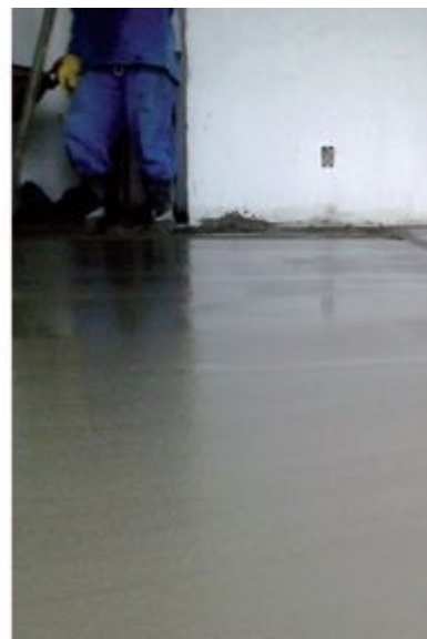
Após executar, com a ajuda de uma empresa especializada, um pavimento-modelo com contrapiso autonivelante, construtora assimilou a técnica de execução e passou a utilizar mão de obra própria no serviço