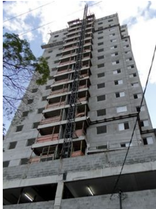
O uso de guias pode não ser uma boa solução em obras atendidas por fornecedores que não conseguem entregar os materiais em paletes