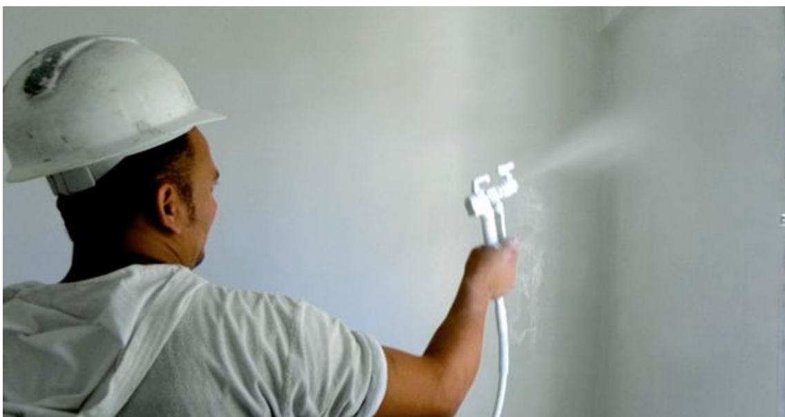
Uma das vantagens do sistema de pintura airless, segundo a construtora, é a redução do desperdício de material, em comparação com a pintura convencional com rolo

"Mas, em média, a produtividade pode ser aumentada em pelo menos o dobro". Além disso, desperdiça-se menos material se comparado à pintura convencional com o rolo. Caruso conta que, com o método manual, o operário não consegue uniformizar o local de aplicação. "Ele acaba tendo de passar o rolo no mesmo local mais de uma vez para fazer arremates, o que não acontece com a pistola." A construtora consegue reduzir ainda mais o prazo de execução da pintura com a utilização da lixadeira elétrica, sem contar que o sistema também pode reduzir o efetivo. "Hoje, com a dificuldade de mão de obra, é complicado conseguir um número grande de funcionários; geralmente as empresas acabam executando os serviços com um número menor de colaboradores e em um período maior, o que pode ocasionar um atraso nas obras", conta Caruso. Um planejamento benfeito e o uso de técnicas diferenciadas, como a pintura airless, acaba equacionando a questão.