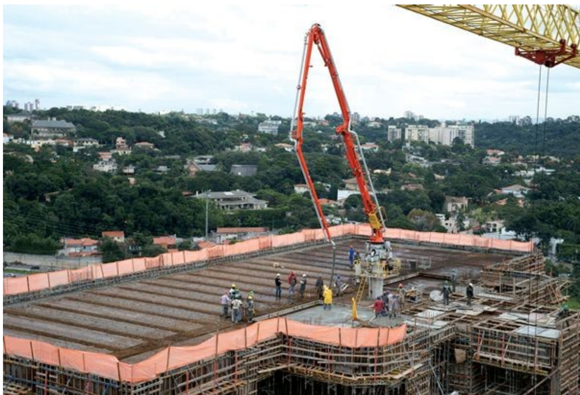
Uso do mastro hidráulico associado ao uso de concreto autoadensável acelerou a execução das lajes do edifício Sky Corporate, em São Paulo

Segundo Mouaccad, caso o concreto convencional tivesse sido utilizado, a execução da laje levaria mais de um dia para acontecer, em função da performance inferior de aplicação e da logística de transporte externo necessária. Por ser fluido, o CAA possibilitou ainda o acabamento homogêneo das peças estruturais, sem a presença de falhas ou juntas frias.