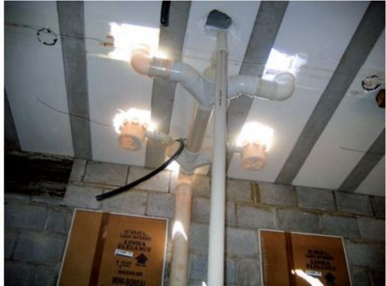
Equipe responsável pelas montagens era formada por apenas um encanador e dois ajudantes