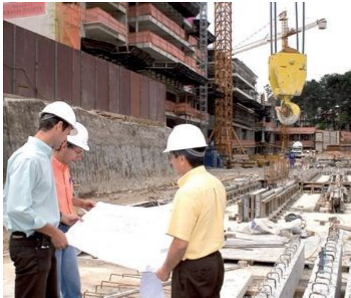
Elevar o grau de industrialização é uma das estratégias eficazes para maximizar a produtividade e reduzir a demanda por mão de obra nos canteiros. Contudo, exige planejamento e projetos mais apurados