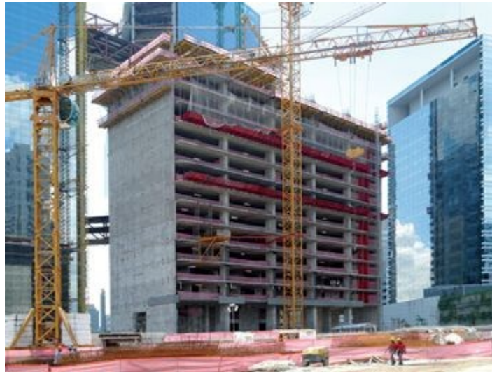
Para a construção de uma torre comercial que compõe o Parque da Cidade, em São Paulo, estão sendo empregadas três guias. A intenção da construtora é evitar gargalos de produção da estrutura, que tem ciclo de seis dias e utiliza lajes alveolares pré-fabricadas