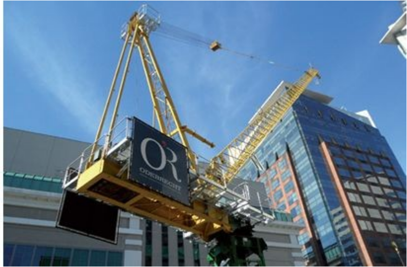
Pórticos rolantes aceleraram a obra e viabilizaram a carga e descarga em terrenos estreitos e com restrição de tráfego. Grua basculante permitiu grandes comprimentos de lança e pequenos giros