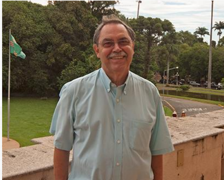
Evaristo Marzabal Neves (Vavá)