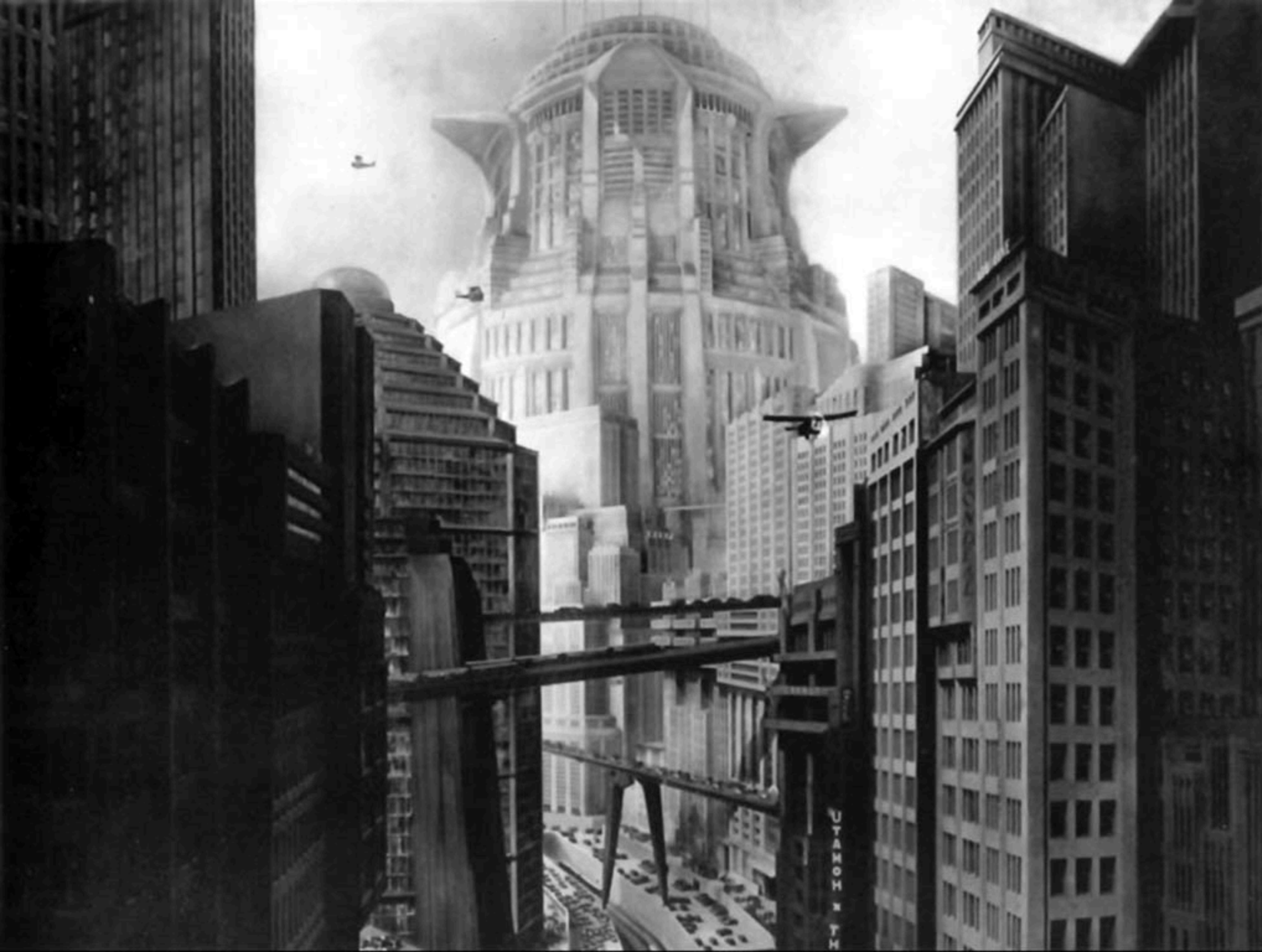
Metropolis, Fritz Lang