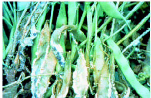
Fig. 1. Sintomas do mofo-branco do feijoeiro comum.

controle obtidos por cada fungicida, o que ocorreu até cinco dias após a pulverização. Os valores em porcentagem foram então transformados para \arcseno \sqrt{x} e submetidos à análise estatística utilizando o teste de Dunnett a 5% para comparação das médias.