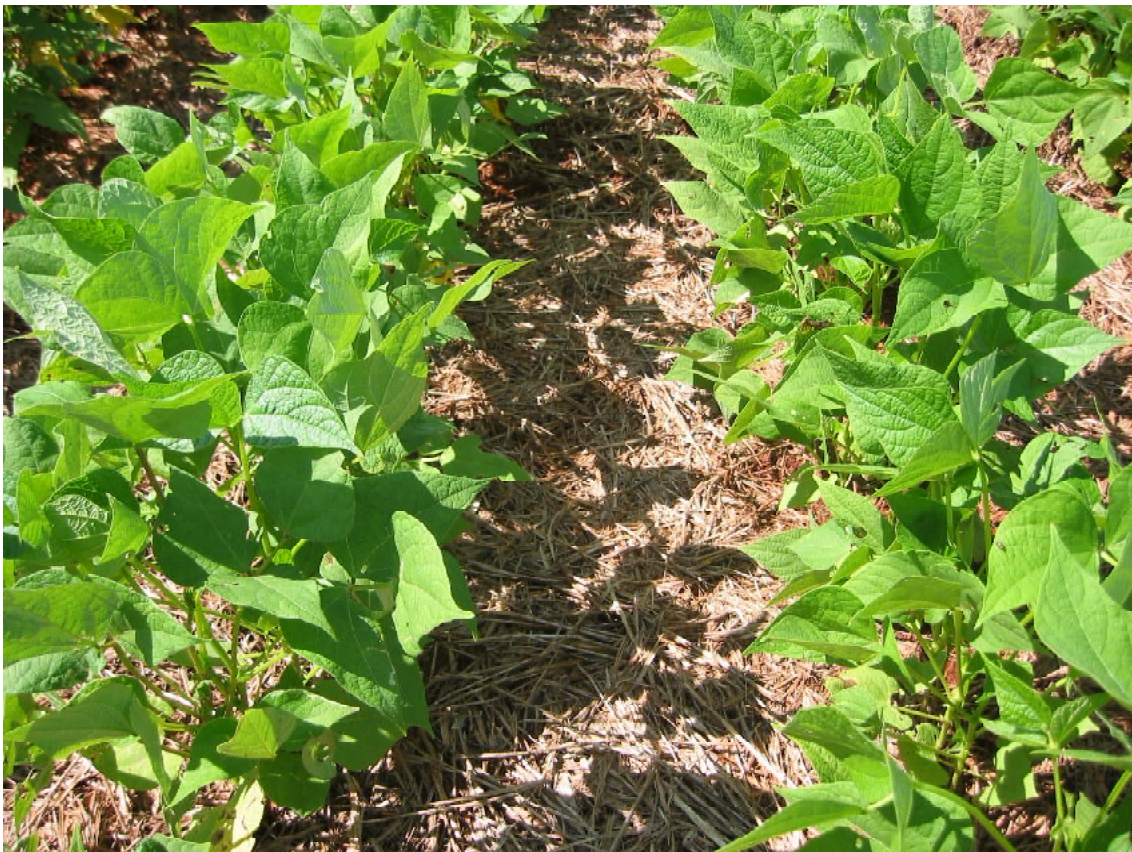
Fig. 3. Desenvolvimento de plantas de feijoeiro comum sobre palhada de Brachiaria ruziziensis .

Estudo conduzido por Costa et al. (1999) demonstrou que foram necessários quatro anos de rotação com milho sem a cultura do feijoeiro para que se obtivesse redução significativa da murcha de Fusarium. As culturas antecedentes avaliadas no presente trabalho, como milheto, braquiária, braquiária com milho e mombaça, podem ser adotadas em esquemas de rotação/sucessão com feijoeiro, em plantio direto, para controle de murcha de Fusarium (Fig. 3). Portanto, há novas opções de culturas para a formação de palhada em SPD que facilitam o manejo da murcha de Fusarium.