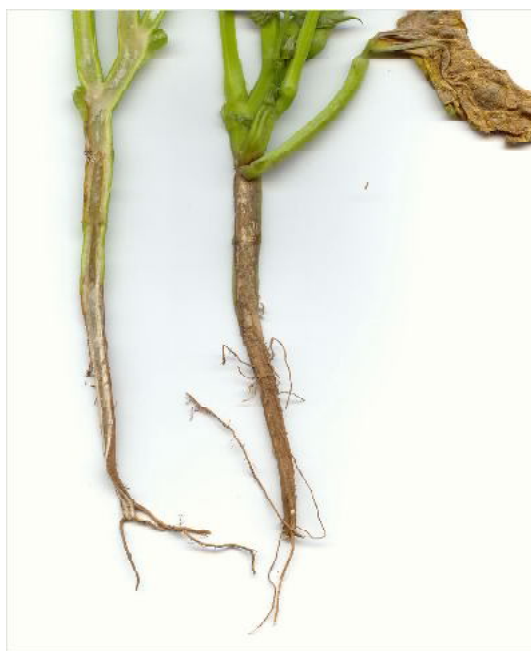
Fig. 1. Murcha de plantas com descoloração vascular e produção de esporos na base da haste principal: sintomas da murcha de Fusarium em feijoeiro comum.

Segundo Pereira e Yokoyama (1999), a incidência de F. oxysporum f. sp. phaseoli nas sementes de feijoeiro tem aumentado devido à utilização de grãos infestados no cultivo de novas áreas. Posteriormente, a Portaria nº 3 do Ministério da Agricultura Pecuária e Abastecimento, de 5 de janeiro de 2004, estabeleceu nível de tolerância zero para algumas Pragas Não Quarentenárias Regulamentadas (PNQR), dentre elas o agente causal da murcha de Fusarium. A implantação dos padrões sanitários de sementes estabelecidos, bem como as ações dos órgãos fiscalizadores, obedece a um cronograma de aplicação onde se prevê a fiscalização dos níveis de tolerância, de todas as classes de sementes, no sétimo ano após a publicação desta Portaria (BRASIL, 2004).