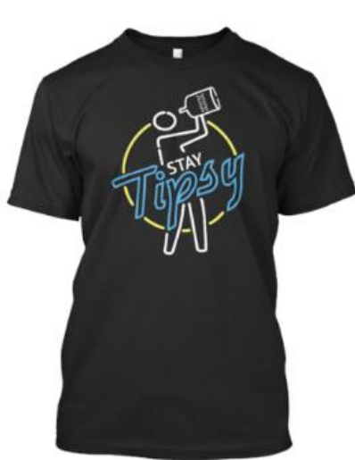
Tipsy Bartender - Stay Tipsy!