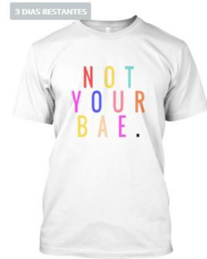
NOT YOUR BAE MULTICOLORED RAI...