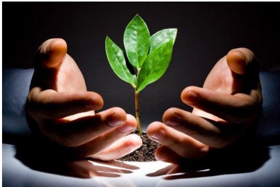
Capital de Risco ( Venture Capital )