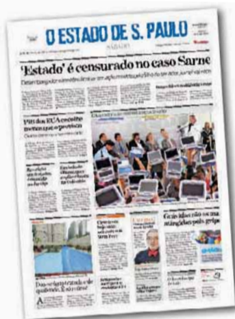
● Sob veto Capa do Estado de 1º de agosto de 2009 informa a mordida que se iniciava e até hoje impede o jornal de informar sobre o caso Sarney

A liberdade de expressão foi conquistada não para o noticiário virtuoso, mas para o debate das ideias, mesmo que fosse um debate virulento. A liber- ➤